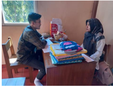
Wawancara Guru BK dan Wali Kelas MTs Al-Innaroh Batang