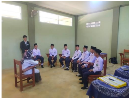
Pelaksanaan Bimbingan Kelompok