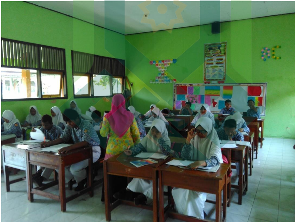
Kegiatan belajar mengajar mata pelajaran Pendidikan Agama Islam