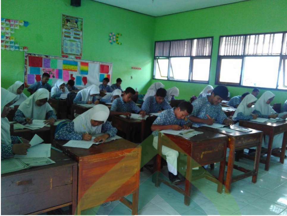
Keadaan siswa kelas 8