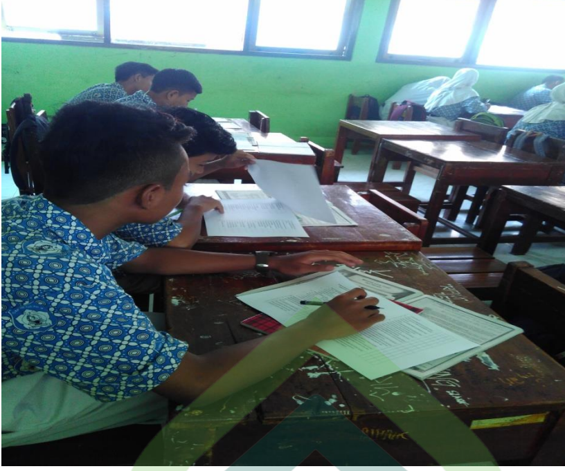
Siswa mengisi angket penelitian