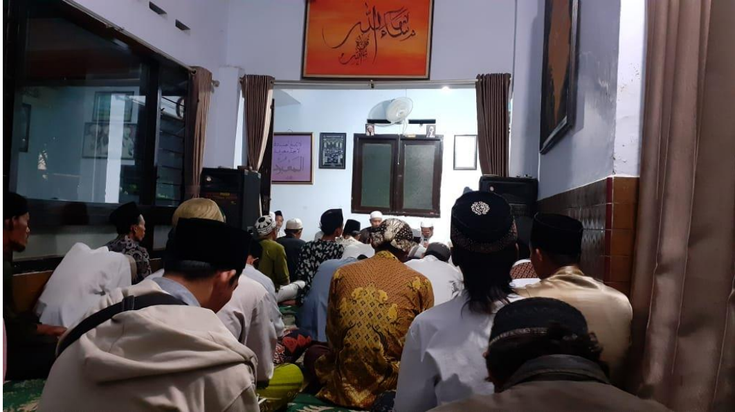
Pengajian Rutin Kitab Jauhar At-Tauhid Setiap Malam Minggu Pukul 22.30- 23.30 Wib (24 September 2022)