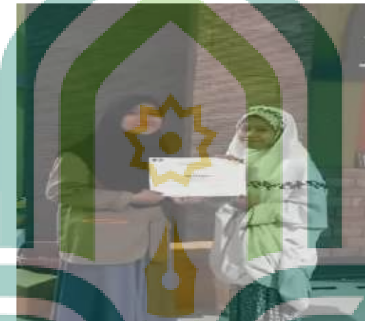
Gambar 9 salah satu reward penghargaan santriwati