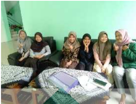
Gambar 8 Wawancara dengan santriwati IBS