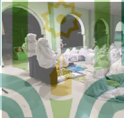
Gambar 6 Ta'ziran telat shalat tahajud berdiri sambil membaca al qur'an