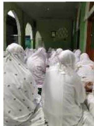
Gambar 4 Pelaksanaan Shalat Tahajud yang dilakukan secara berjama'ah