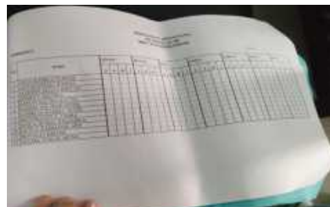
Gambar 7 Bukti Absen sholat tahajud santri yang terlambat