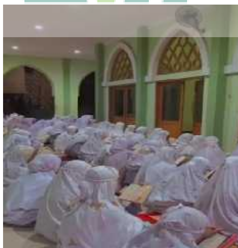
Gambar 10 Kegiatan Khataman Al-Qur'an oleh santri IBS Darul Ulum