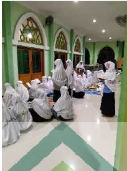
Gambar 5 Ta'ziran atau hukuman terlambat shalat tahajud : berdiri dibelakang shaff masing-masing setelah selesai shalat dan salam witr