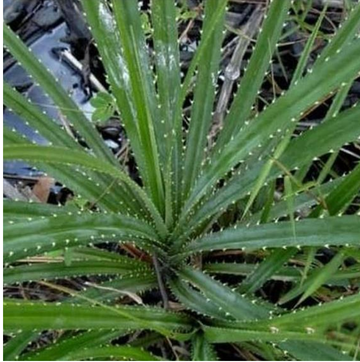
Gambar 3 Tanaman Pandan Berduri