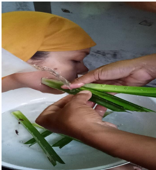
Gambar 2 Proses Pengobatan 2