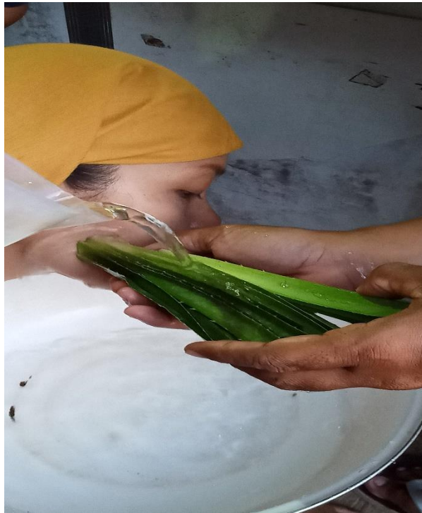
Gambar 1 Proses Pengobatan 1