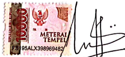
KHISNATUL HIDAYAH NIM.2220001