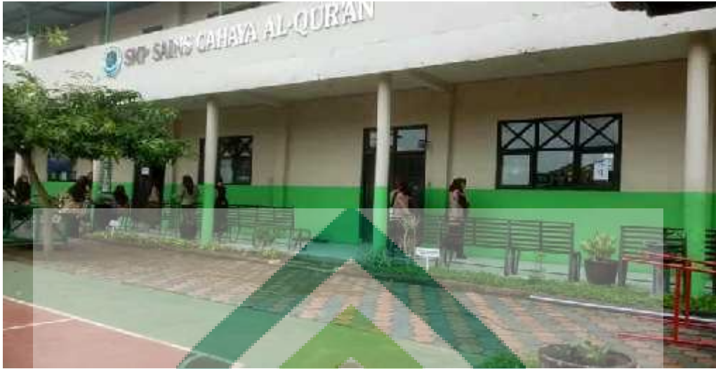
SMP Sains Cahaya Al-Qur'an