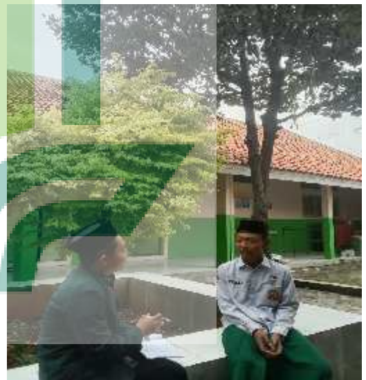
Wawancara dengan siswa siswi Smp sains Cahaya al-qur'an