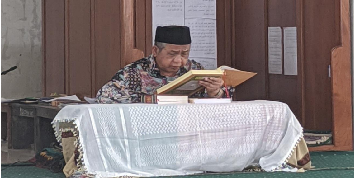
Foto-foto Kegiatan Pengajian Mingguan Kitab Ihya' Ulumuddin Di Pondok Pesantren Syafi'i Akrom Kota Pekalongan