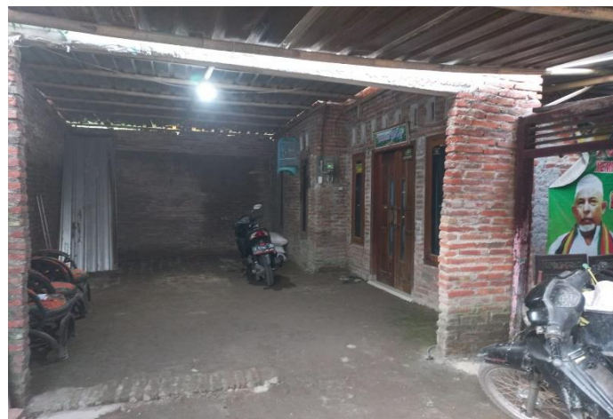
Gambar 2. Halaman depan Rumah Ruqyah dan Terapi Al-Qur'an