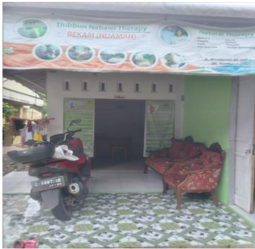
Rumah terapi Kajej, Pekalongan