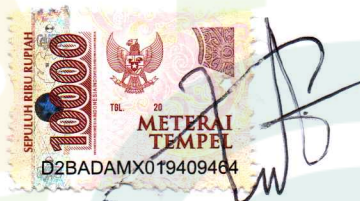
ANGGA SAPUTRA NIM. 2121041

Pekalongan, 14 Oktober 2024 Yang Menyatakan,