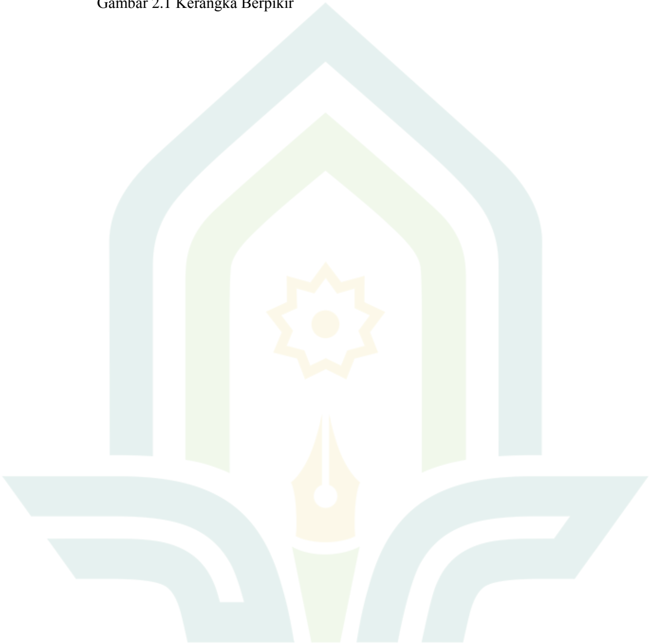
Gambar 2.1 Kerangka Berpikir