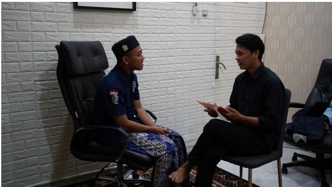
Gambar Dokumentasi 2 Wawancara dengan Koordinator media Jati Sumo Negoro