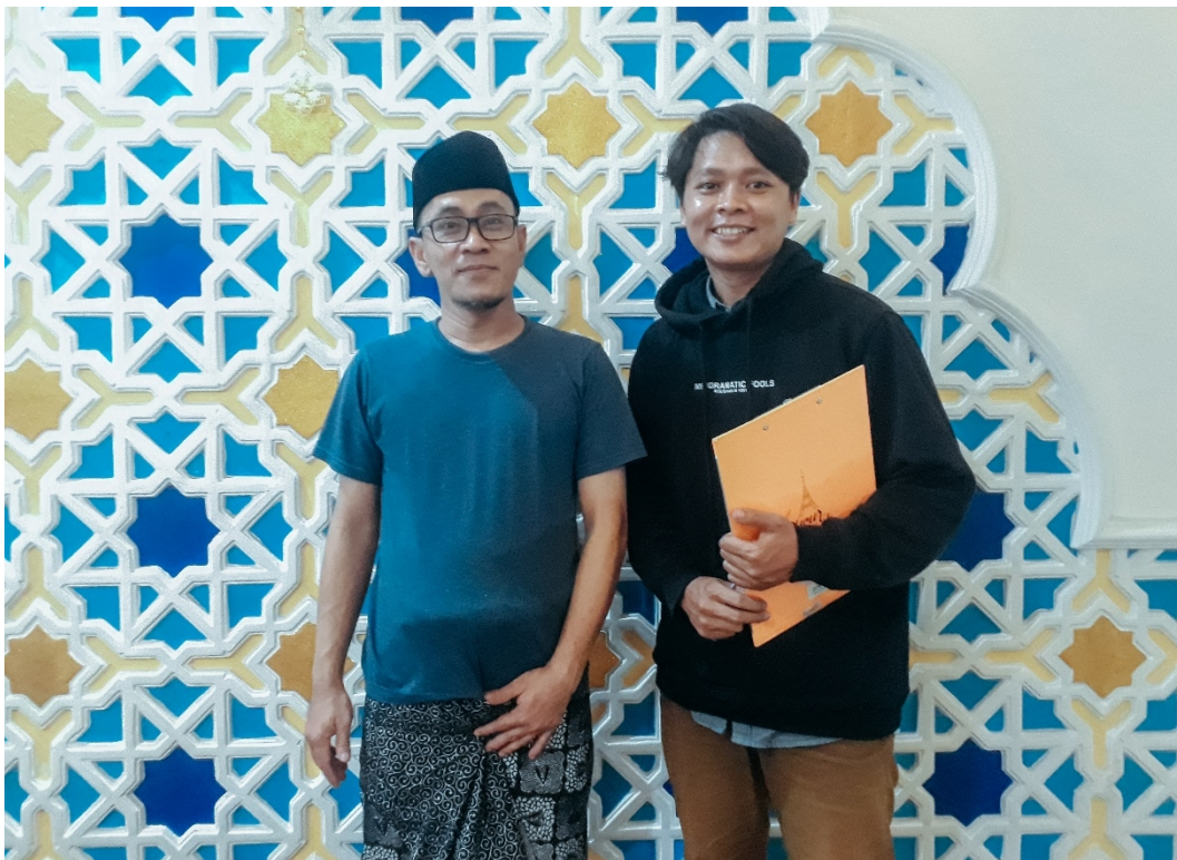
Gambar Dokumentasi 4 Wawancara dengan Sekretaris sekaligus sebagai penanggung jawab program di Youtube Jati Sumo Negoro