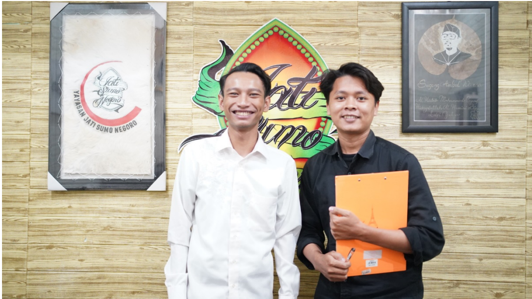
Gambar Dokumentasi 3 Wawancara dengan Sekretaris Yayasan Jati Sumo Negoro