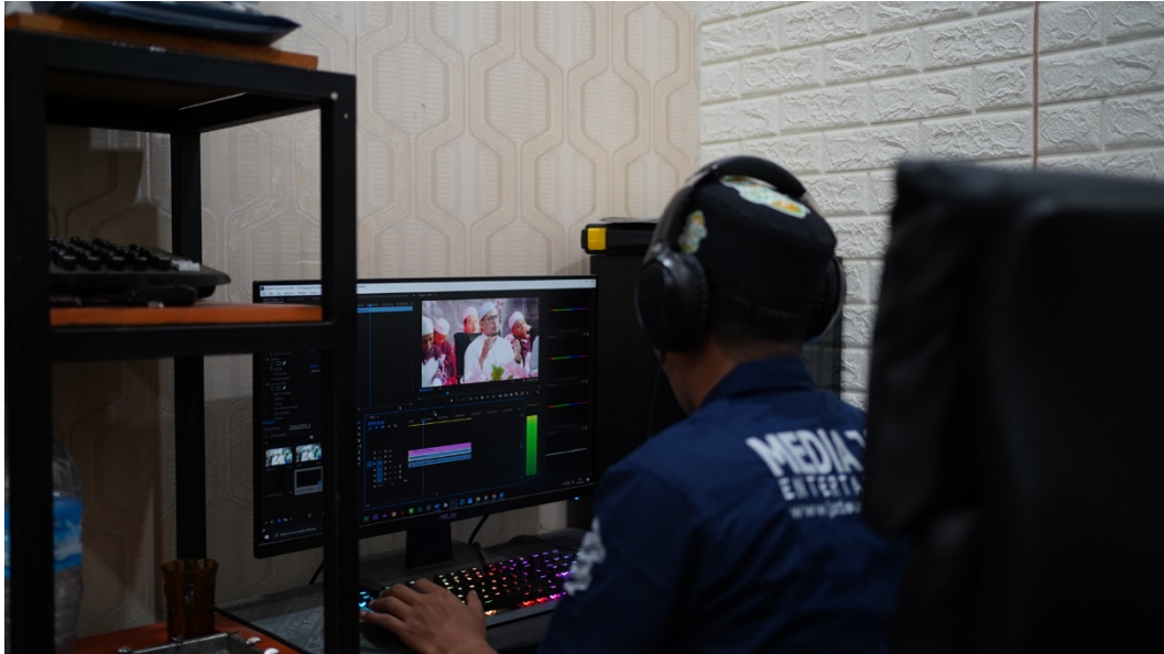
Gambar Dokumentasi 1 Ruang Editing Video dakwah Jati Sumo Negoro