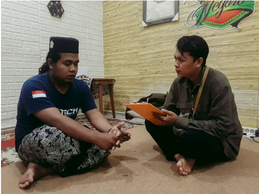
Gambar Dokumentasi 5 Wawancara dengan Operator live streaming program di Youtube Jati Sumo Negero