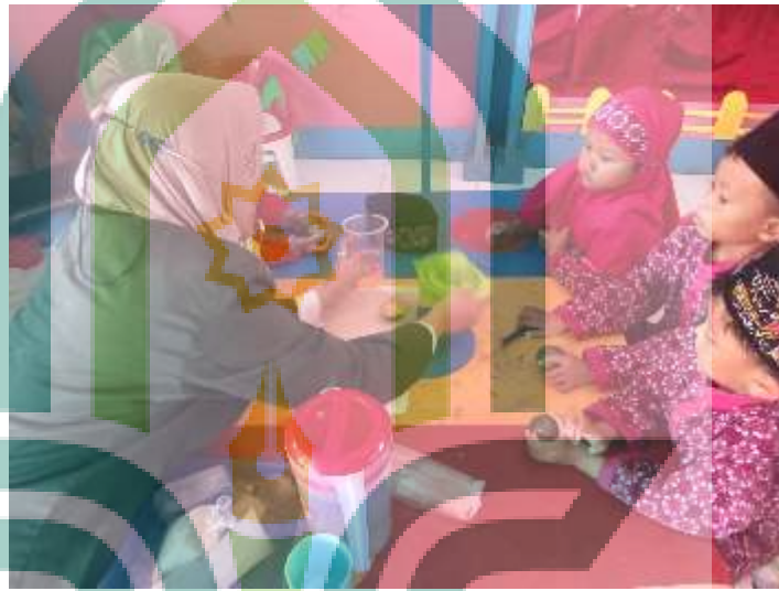
membuat es jeruk