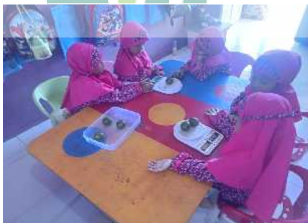
Menimbang buah jeruk