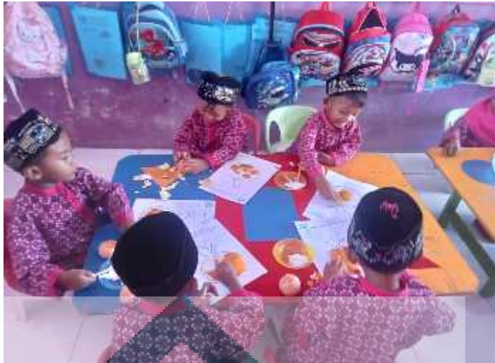
Kolase gambar jeruk menggunakan kulit jeruk