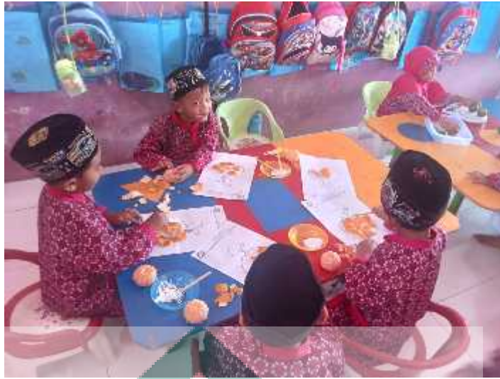
kolase gambar jeruk