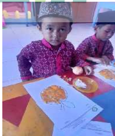
Kolase buah jeruk menggunakan jeruk