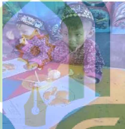
Kolase gambar jeruk menggunakan ku