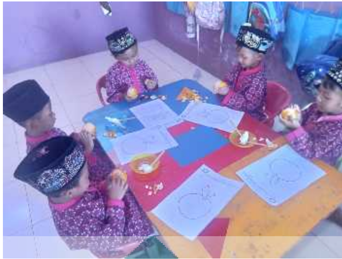
kolase gambar jeruk