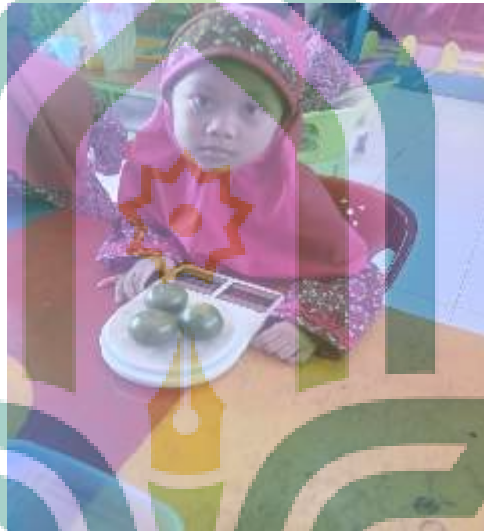
menimbang buah jeruk