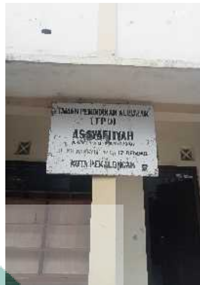
Gedung TPQ Asy-Syafi'iyah Bendan Kota Pekalongan