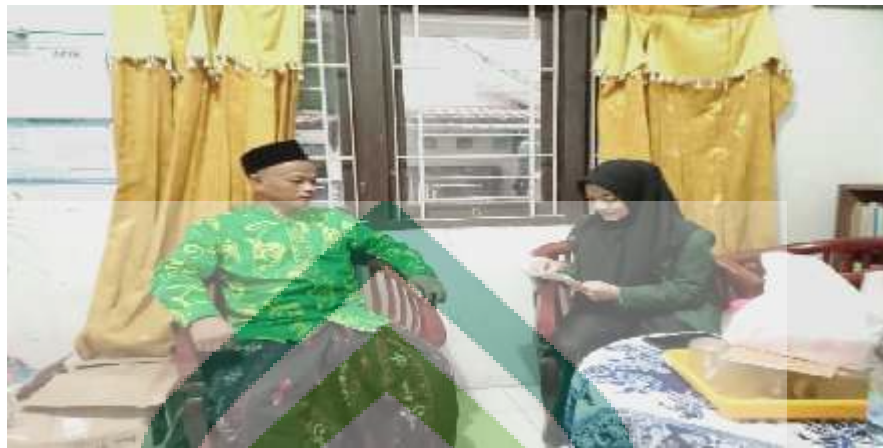
Wawancara dengan Kepala TPQ Asy-Syafi'iyah