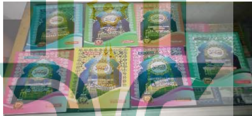
Jilid Fashohati PRA – 6