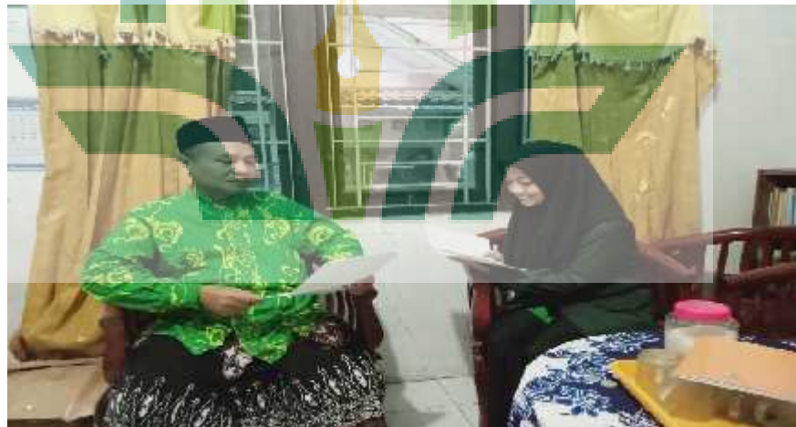
Wawancara dengan Guru Pengajar TPQ