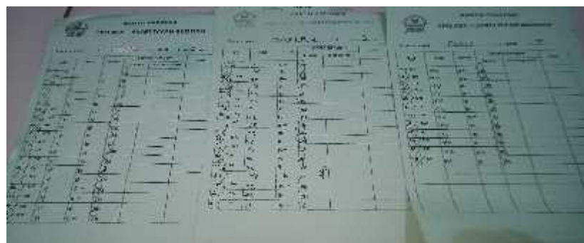
Kartu Prestasi Siswa