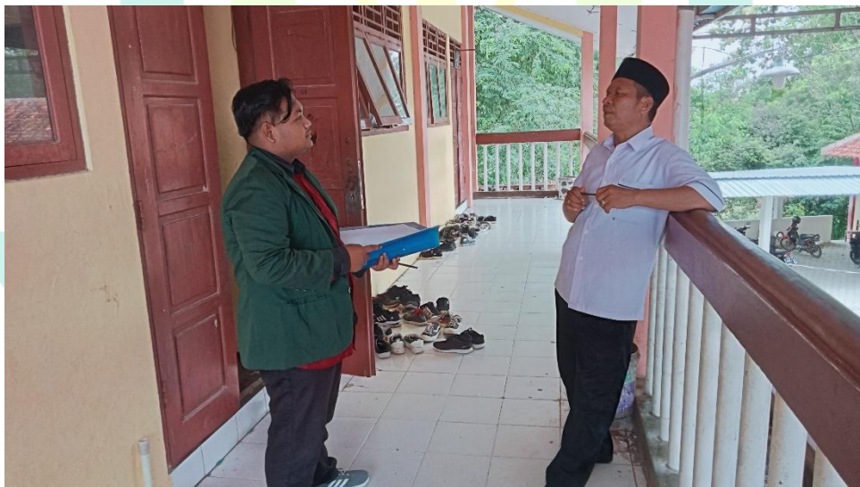
Gambar 1.2 Pelaksanaan Wawancara Bahasa Arab Guru di MTs Jatibogor.