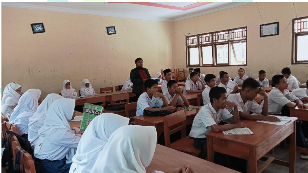
Gambar 1.4 Pelaksanaan pembelajaran Bahasa Arab di MTs Jatibogor.