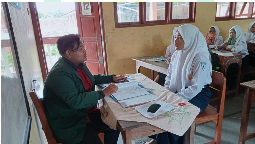
Gambar 1.3 Pelaksanaan Wawancara Bahasa Arab Siswa di MTs Jatibogor.