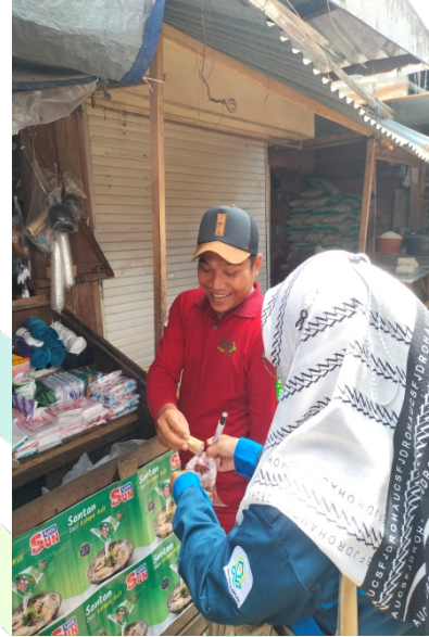
Fundraising Kotak Infak Plastik LP Ma'arif Doro dan Fundraising Kaleng Infak Pasar Tradisional Doro