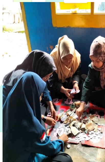
Fundraising Kotak Kaca di Toko Kecamatan Doro dan Penghitungan Hasil Fundraising Kaleng Koin NU Ranting Dorongan Kec. Doro.