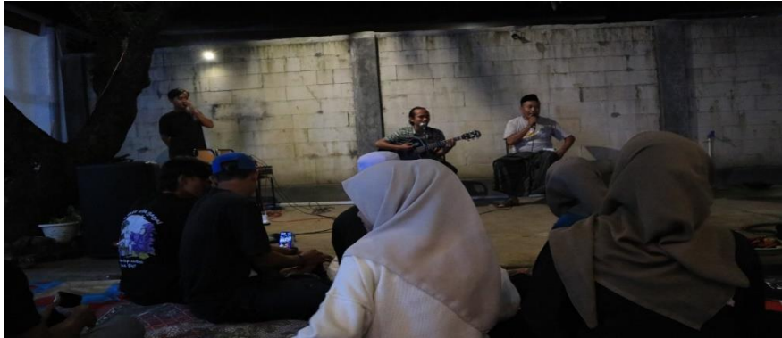
Kegiatan Jejak Matja