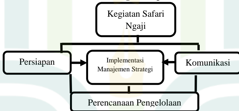
Tabel 1.1 Kerangka Berpikir

Kerangka berpikir adalah salah satu model yang dirancang secara konseptual tentang suatu teori dapat berhubungan dengan bermacam-macam aspek yang sebelumnya telah ditandai sebagai suatu persoalan yang terbilang penting. 16 Adanya kerangka berpikir ini diharapkan dapat memperjelas pokok atau inti dari penelitian yang akan dikaji. Penelitian ini terlebih dahulu melakukan wawancara secara langsung ke Ketua IPNU IPPNU Wonopringgo dengan melihat keadaan yang ada. Kemudian, peneliti melakukan wawancara kepada objek yang diteliti. Hingga, peneliti bermaksud guna dilakukannya penelitian yang judul “Implementasi Manajemen Strategi Dalam Pengelolaan Kegiatan Safari Ngaji (Studi Kasus IPNU IPPNU Wonopringgo)” maka kerangka berpikir yang digunakan guna mengetahui beberapa indikator dapat diketahui melalui diagram sebagai berikut: