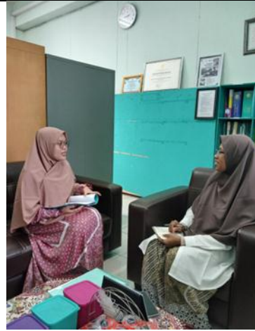
Wawancara dan Observasi Dokumen