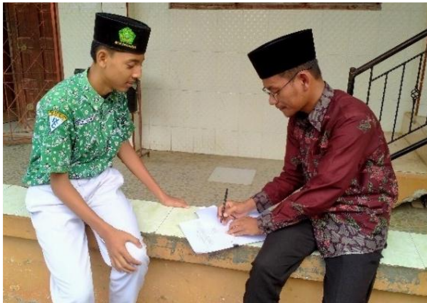
Wawancara dengan siswa kelas 9