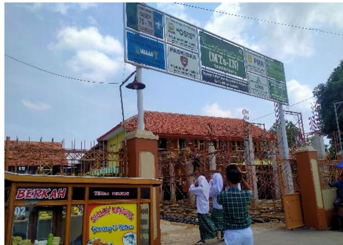
Gedung MTs IN