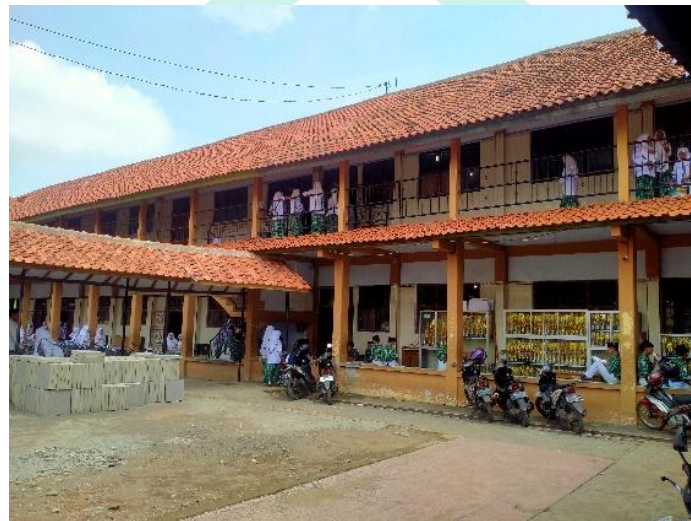
Gedung MTs IN