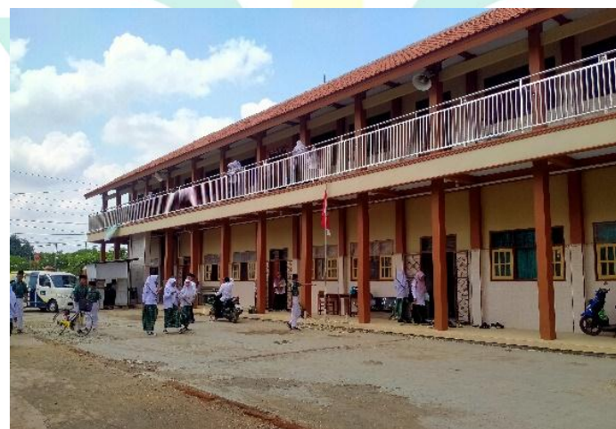
Gedung MTs IN