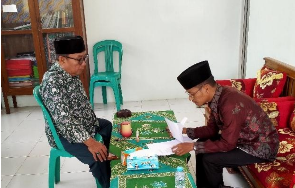
Wawancara dengan Kepala Madrasah