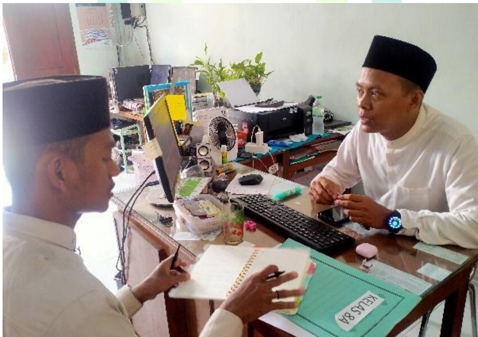
Wawancara dengan guru PAI