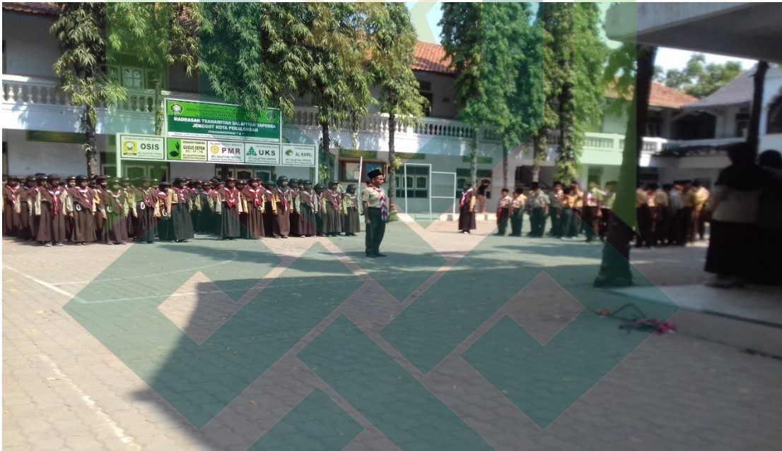
APEL PEMBUKAAN LATIHAN