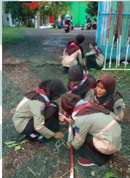
Gambar 4 Siswa melakukan praktik tali temali

Praktik tali temali yang merupakan salah satu materi dalam pramuka tengah dilakukan oleh siswa di lingkungan sekolah pada saat jam ekstrakurikuler pramuka berlangsung.