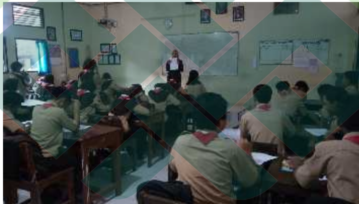
Gambar 2 Penjelasan mengenai tata cara pengisian angket

Peneliti memberikan penjelasan singkat mengenai tata cara pengisian angket yang benar kemudian responden melakukan pengisian angket penelitian. Kegiatan ini dilakukan pada saat jam ekstrakurikuler pramuka berlangsung.