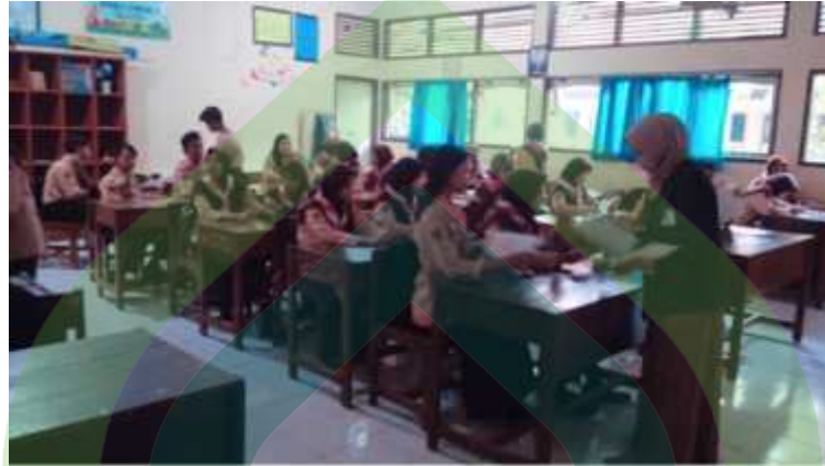
Gambar 1 Proses pembagian lembar angket kepada responden

Proses pembagian lembar angket untuk diisi oleh responden dilakukan di ruang kelas masing-masing untuk mempermudah jalannya pengisian angket penelitian oleh responden.