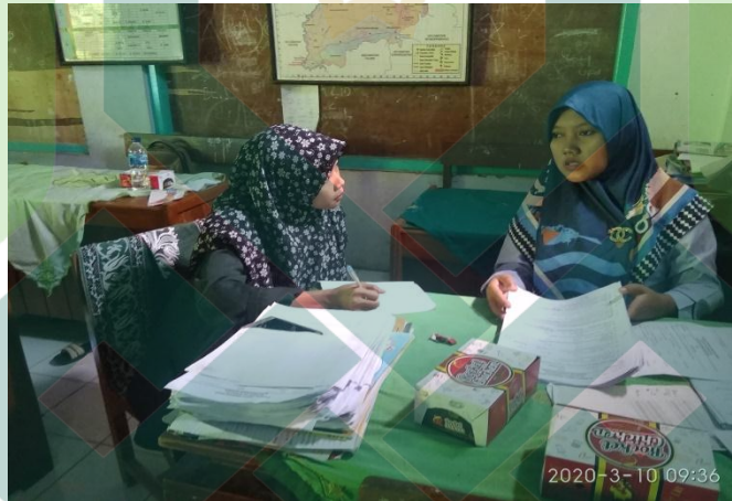
Gambar 2 Wawancara dengan Guru Mata Pelajaran Alquran Hadis Kelas IV Madrasah Ibtidaiyah Islamiyah Wiroditan Bojong Kabupaten Pekalongan.