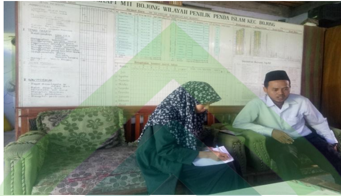
Gambar 1 Wawancara dengan Kepala Madrasah Ibtidaiyah Islamiyah Wiroditan Bojong Kabupaten Pekalongan.