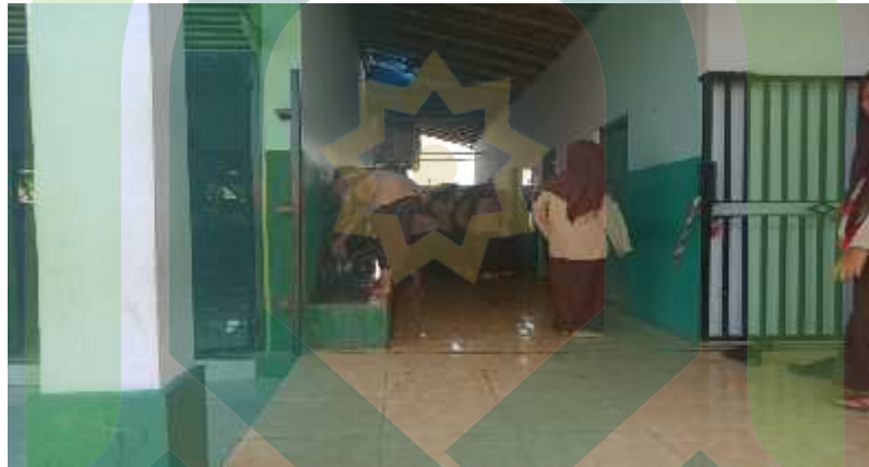
Persiapan Sebelum Sholat Dhuhur Berjamaah (05/8-D/PKPK/29-X/2019)