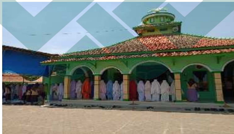
Kegiatan Salat Zuhur Berjamaah (03/8-D/PKPK/29-X/2019)