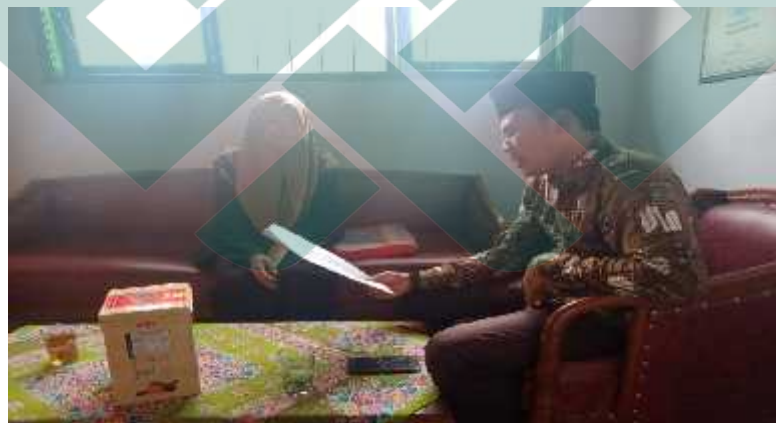
Wawancara dengan Kepala Sekolah (06/8-D/PKPK/02-XI/2019)