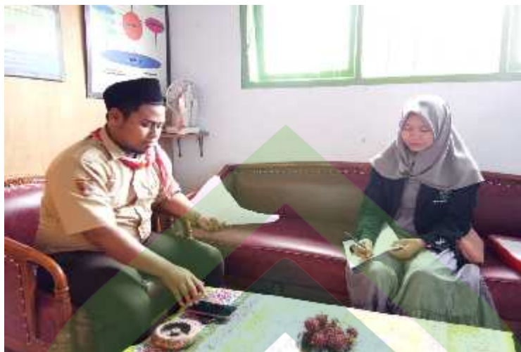
Wawancara dengan Waka Kesiswaan (07/8-D/PKPK/02-XI/2019)