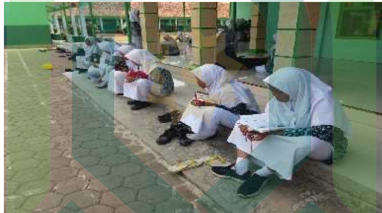
Kegiatan Menghafal Al-Quran (02/8-D/PKPK/04-XI/2019)