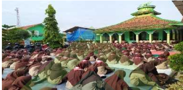
Kegiatan Salat Duha Berjamaah (01/8-D/PKPK/03-XI/2019)