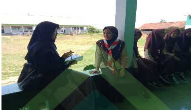
Wawancara dengan Siswa Kelas XI (04/8-D/PKPK/02-XI/2019)