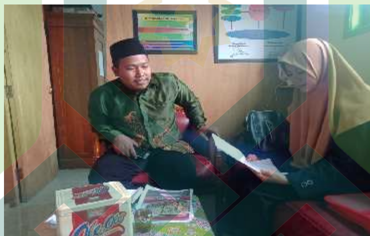
Wawancara dengan Guru Agama (08/8-D/PKPK/27-X/2019)