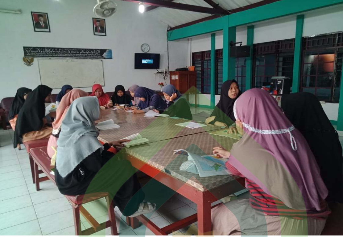
Gambar 11: Kegiatan Belajar