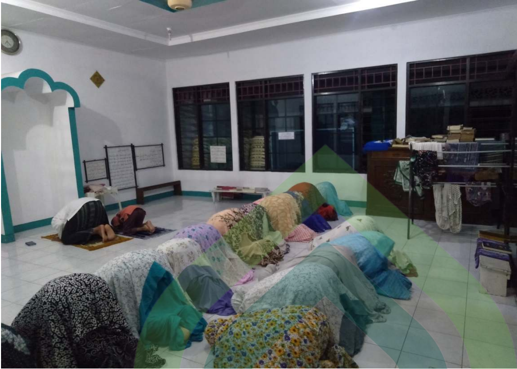
Gambar 9 : Sholat Berjama'ah