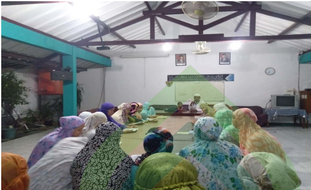
Gambar 7: Tilawatil Qur'an dan Tahfidz