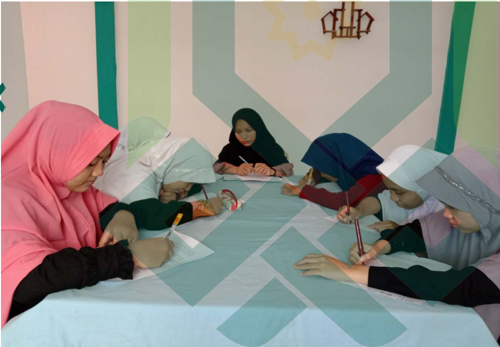
Gambar 10 : Kegiatan Belajar