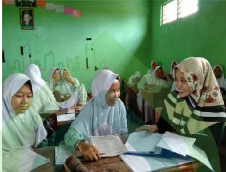
Proses kegiatan belajar mengajar mata pelajaran bahasa Arab

Peserta didik mengamati mufradat yang dituliskan guru