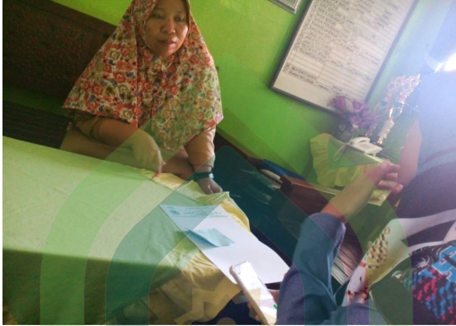
Wawancara dengan Guru bahasa Arab