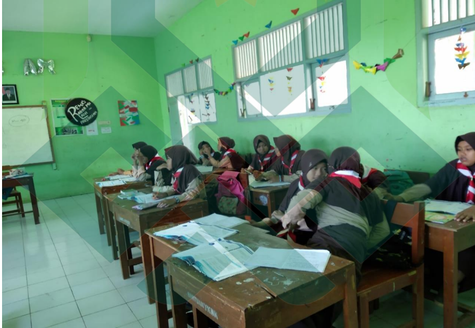
Proses pembelajaran bahasa Arab