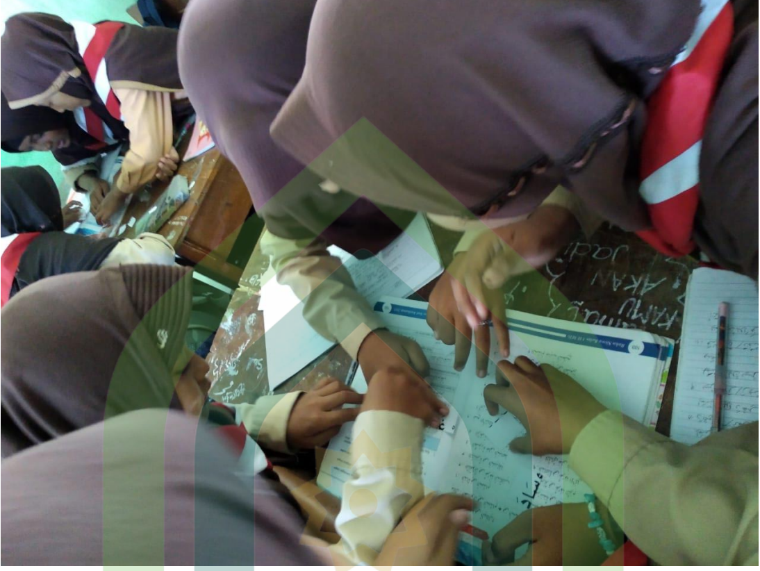
Kegiatan merangkai mufradat