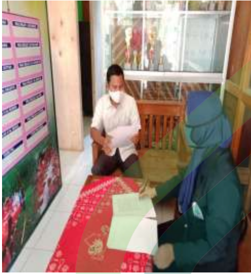
Wawancara dengan kepala sekolah