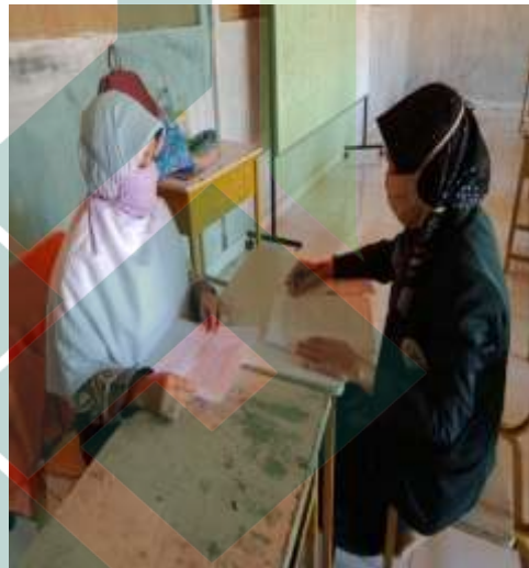
Wawancara dengan waka kesiswaan