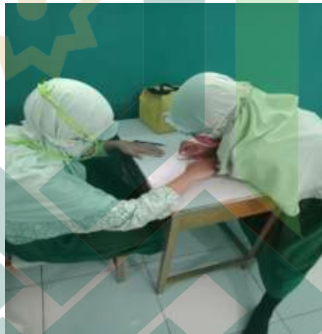
Siswa sedang diskusi