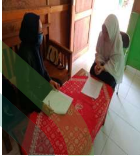
Wawancara dengan waka kurikulum