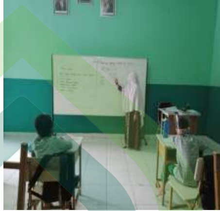
Guru menjelaskan materi