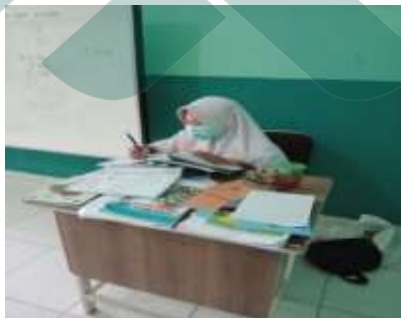
Guru memeriksa hasil kerja siswa