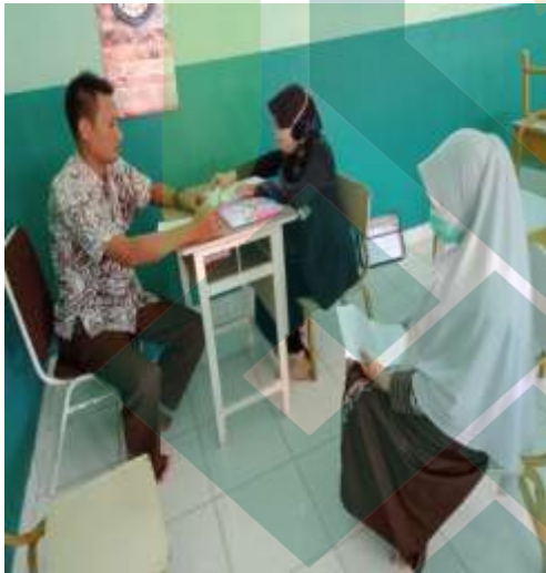
Wawancara dengan guru kelas III