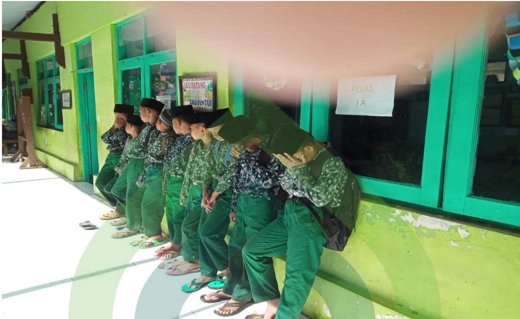
(Peneliti sedang melakukan observasi sekaligus menemukan peserta didik yang sedang dihukum karena melanggar tata tertib MI Salafiyah Karangjampo)