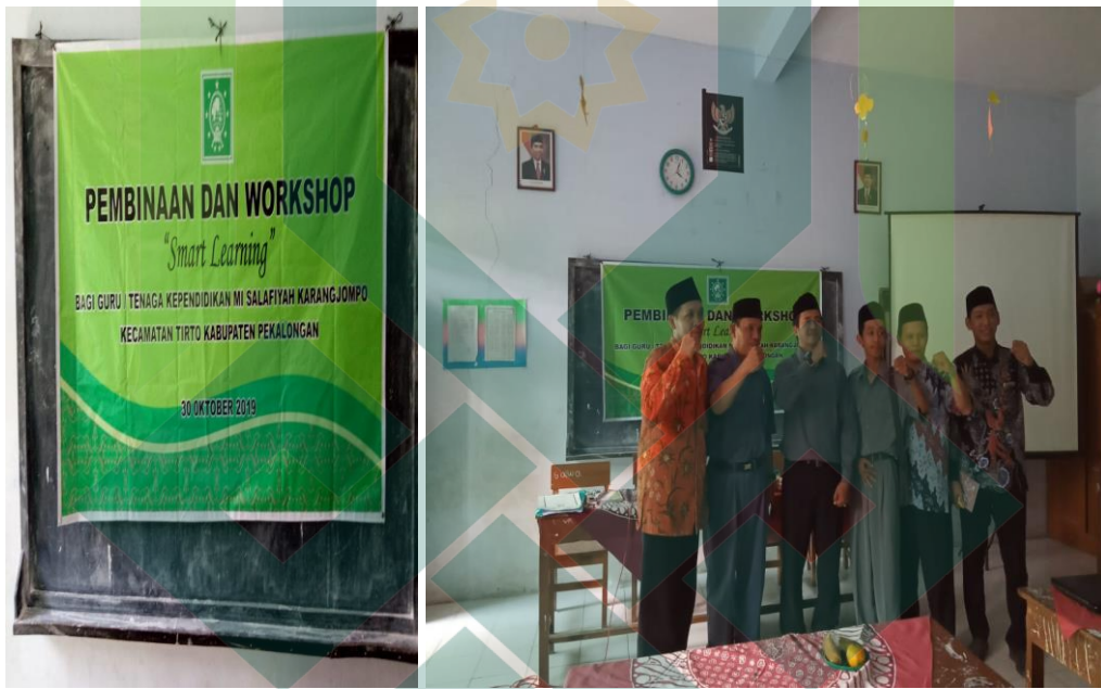
(Kegiatan Pembinaan dan Workshop bagi Kepala, Guru, dan Karyawan bersama Pengurus MI Salafiyah Karangjampo)