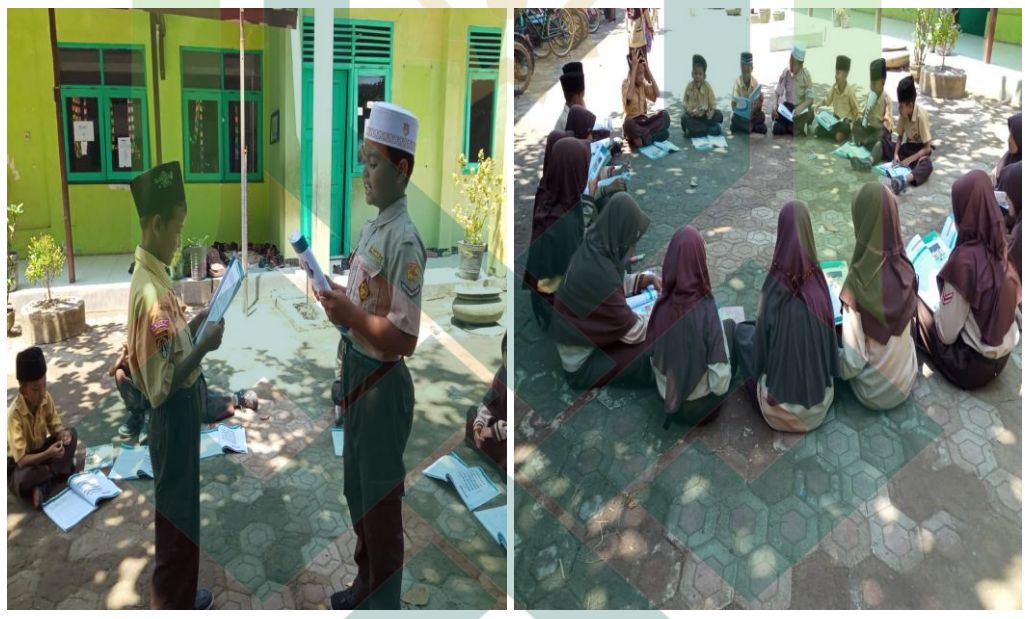
(kegiatan pembelajaran di luar kelas)