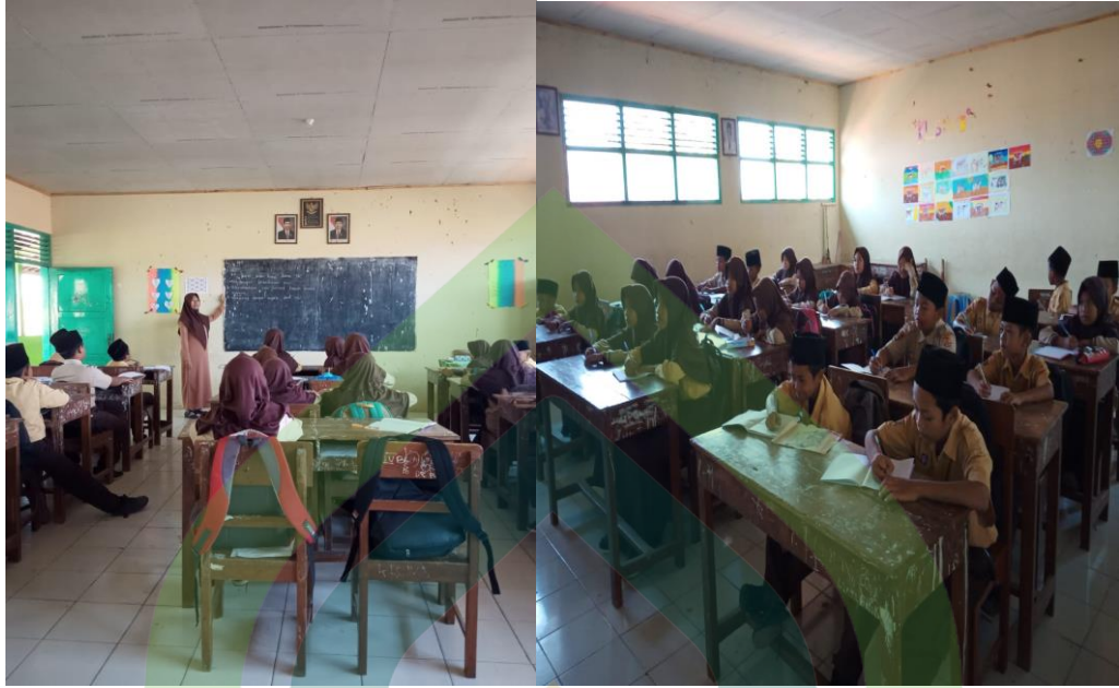
(Kegiatan Pembelajaran di dalam Kelas)