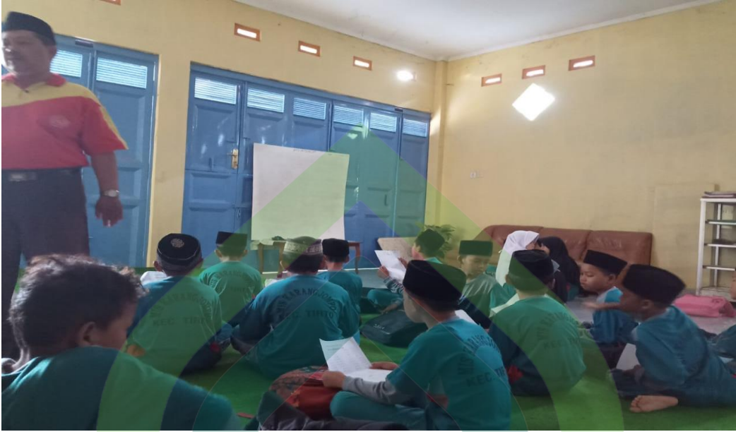
(Kegiatan membaca asmaul husna dan ayat pendek di kelas)