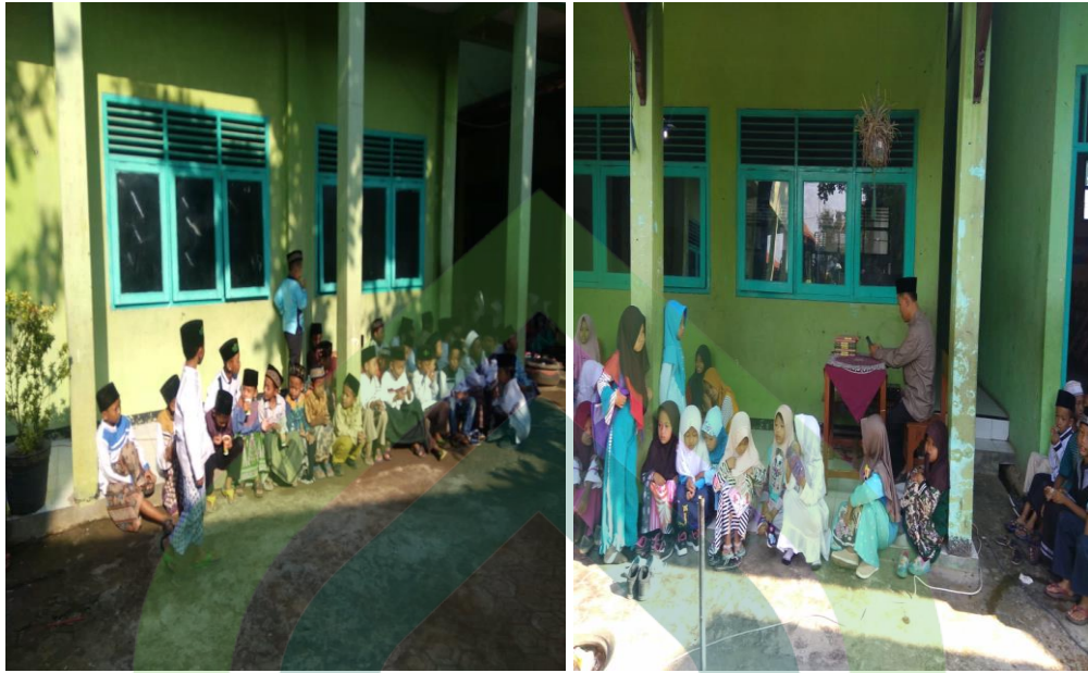
(Kegiatan peringatan hari besar Islam di MI Salafiyah Karangjampo)