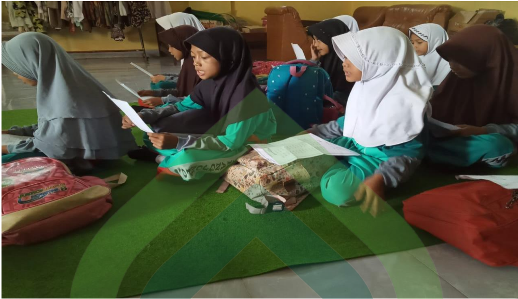
(Kegiatan Pembiasaan sebelum pulang sekolah)