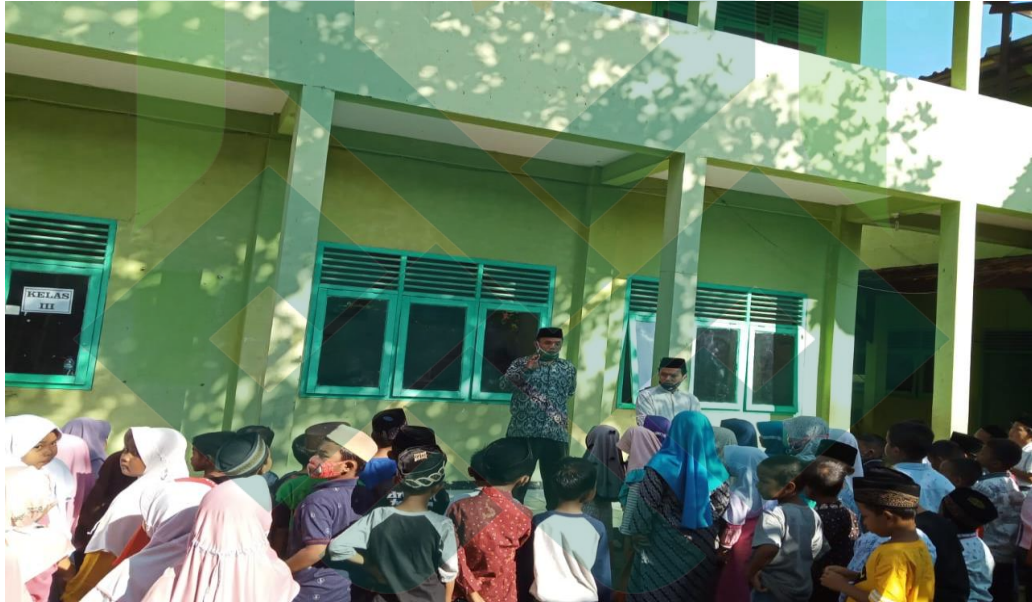
(Kegiatan pembiasaan doa pagi di halaman)