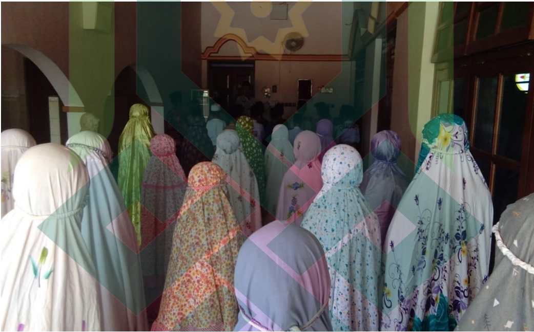
(Kegiatan sholat berjama'ah di masjid)