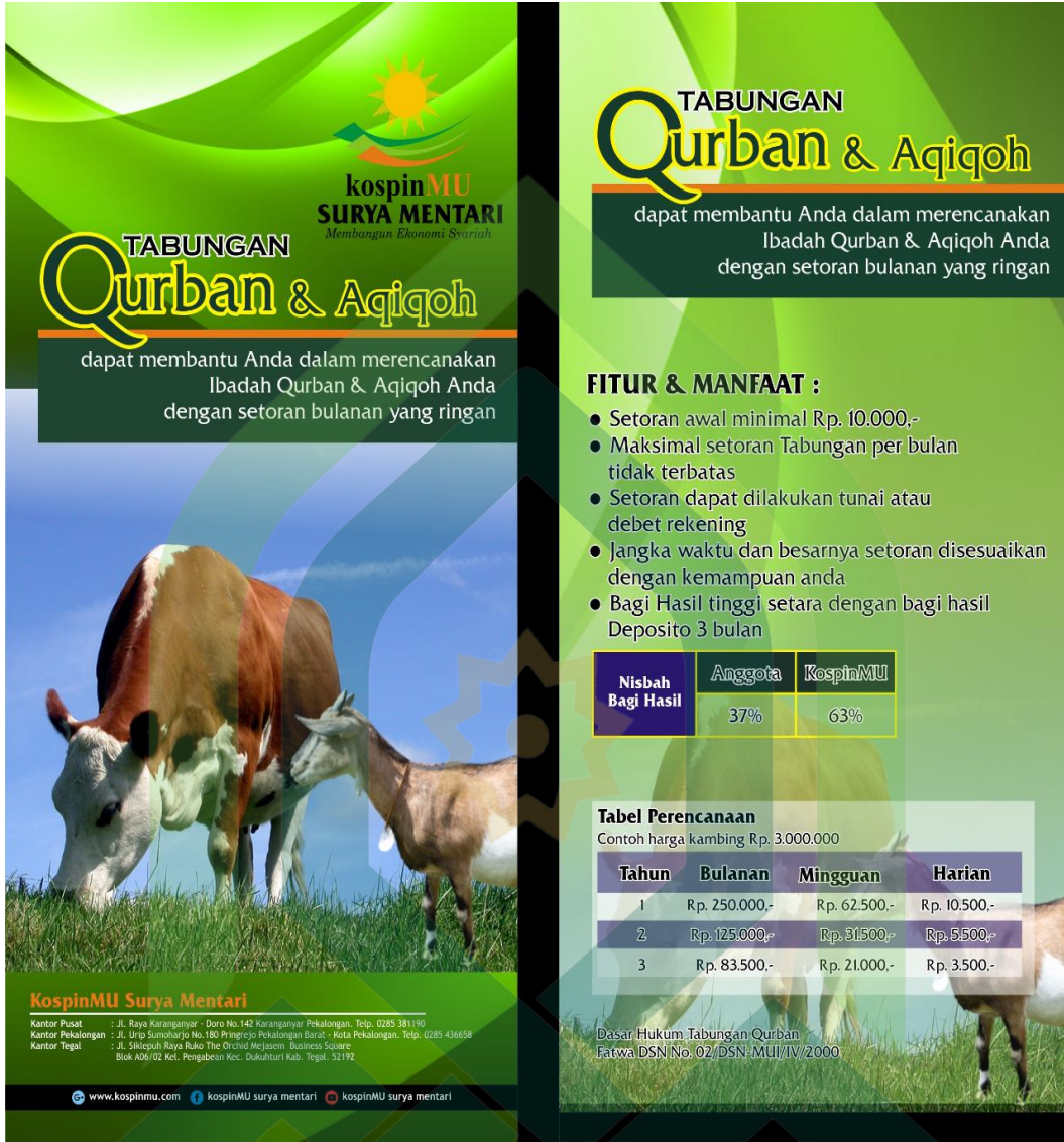
Brosur Tabungan Qurban dan Aqiqoh