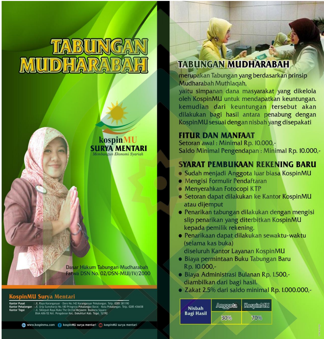
Brosur Tabungan Mudharabah