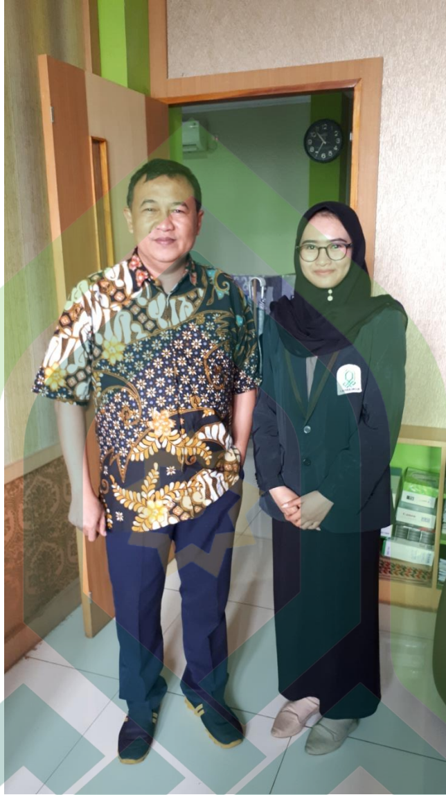
Wawancara Pertama Foto ini Diambil Pada hari Kamis, 25 April 2019 pukul 10:30 WIB di KospinMU Surya Mentari Karanganyar Kabupaten Pekalongan pada saat Wawancara.