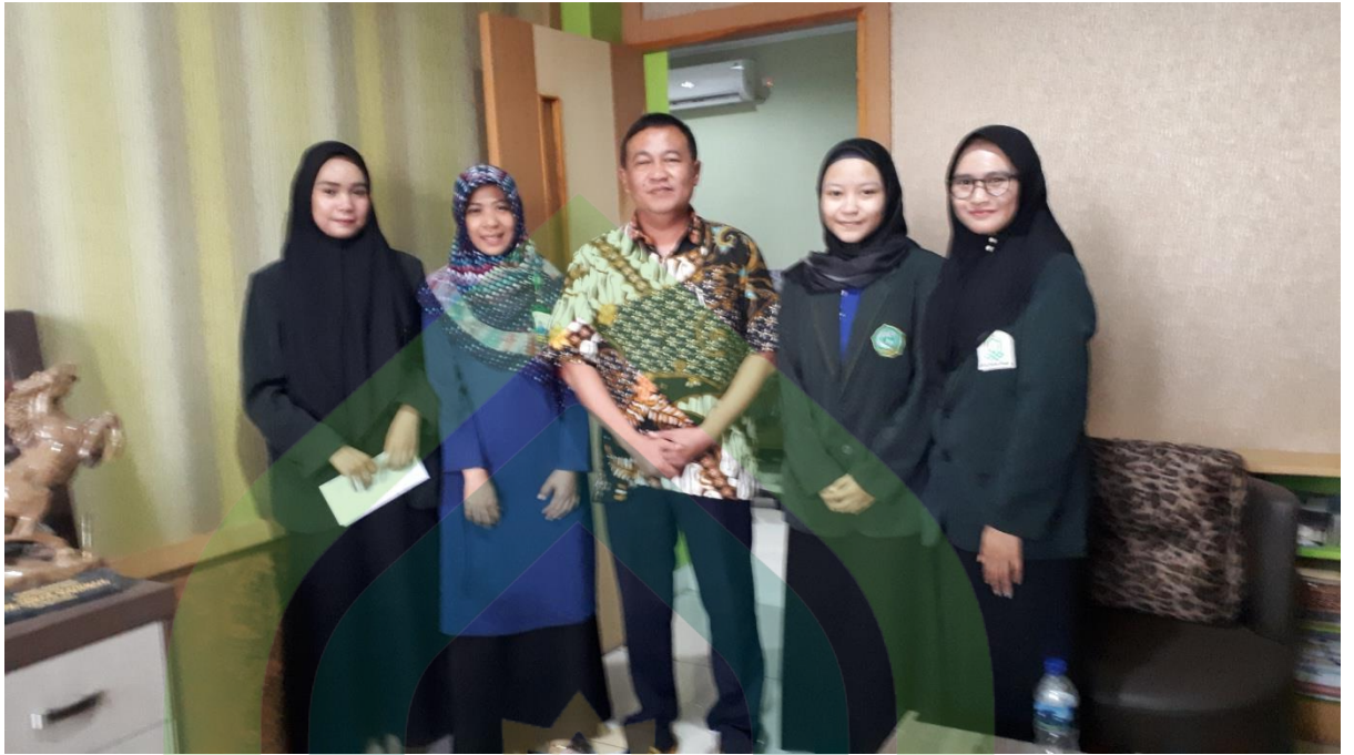
Foto ini diambil pada hari Kamis, 25 April 2019 pukul 15:50 WIB di KospinMU Surya Mentari Karanganyar Kabupaten Pekalongan pada saat Magang.