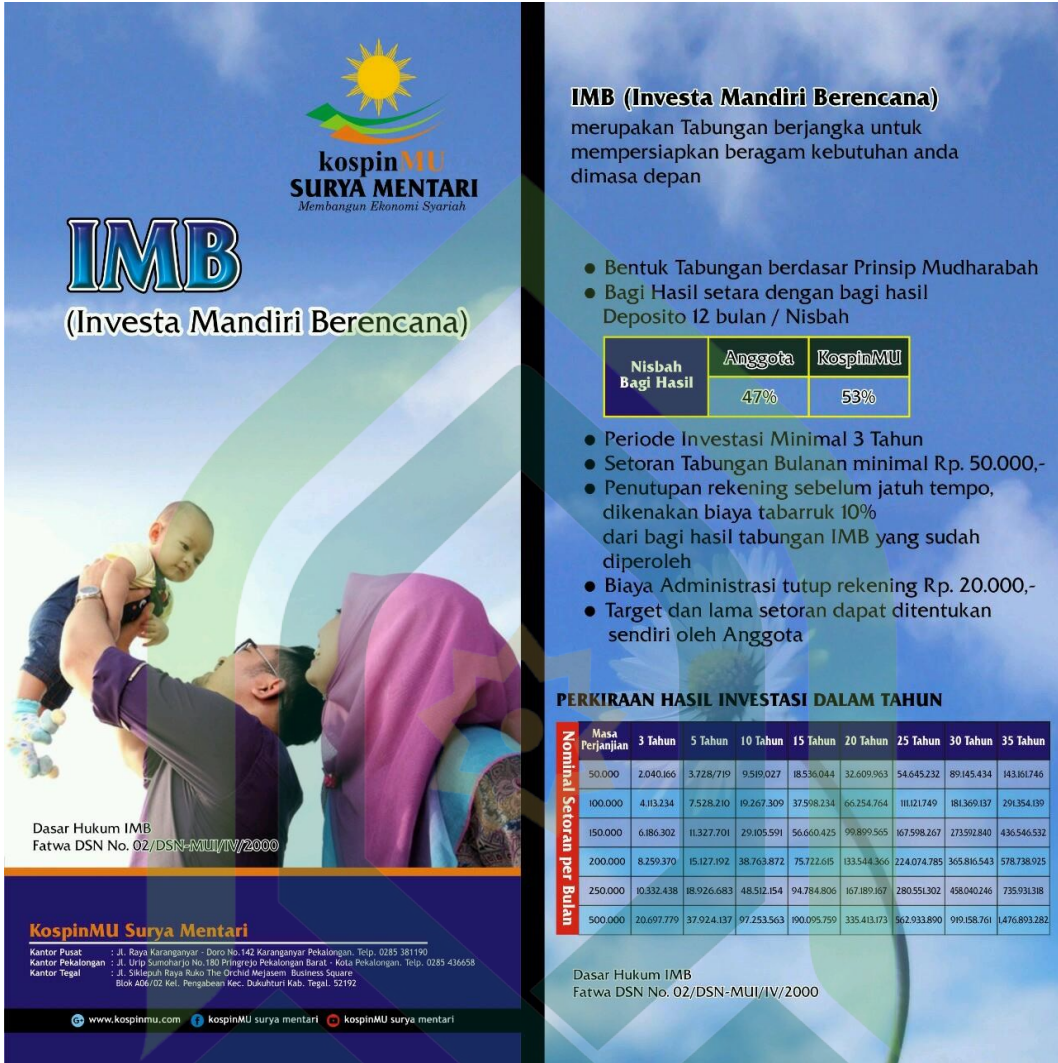
Brosur Tabungan IMB (Investa Mandiri Berencana)