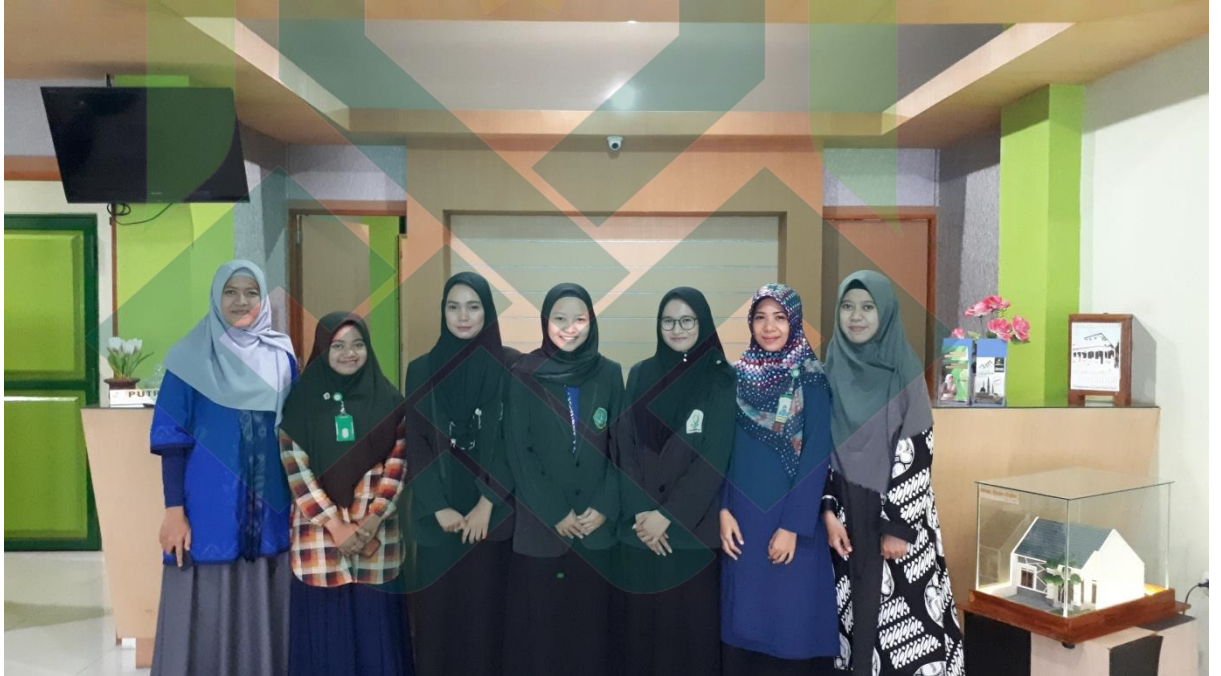
Foto ini diambil pada hari Kamis, 25 April 2019 pukul 15:55 WIB di KospinMU Surya Mentari Karanganyar Kabupaten Pekalongan pada saat Magang.