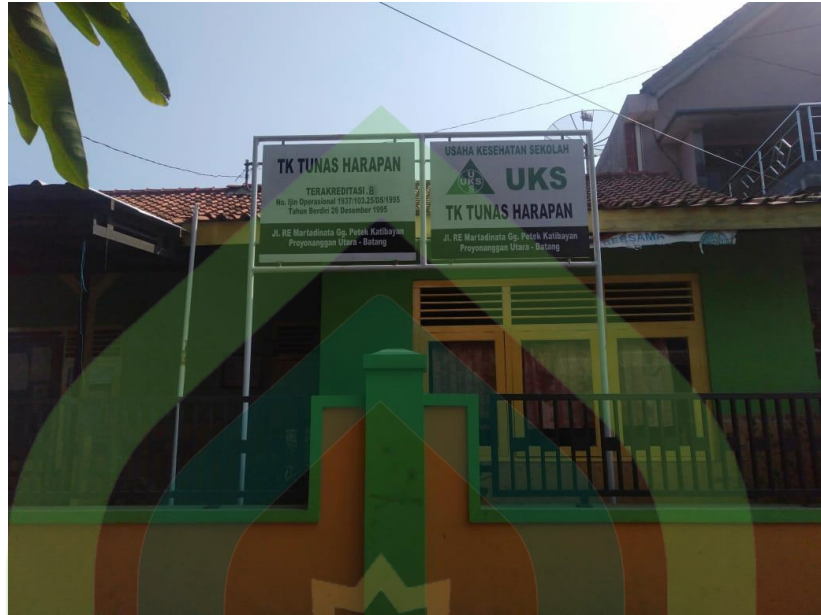
Foto Halaman Depan Sekolah