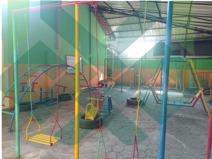
Foto Tempat Bermain anak-anak