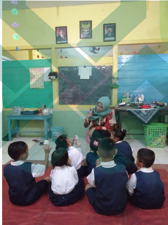
Foto Kegiatan Bercerita Menggunakan Media Boneka Jari