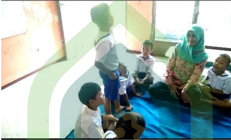
Kegiatan pembelajaran bercerita di dalam kelas