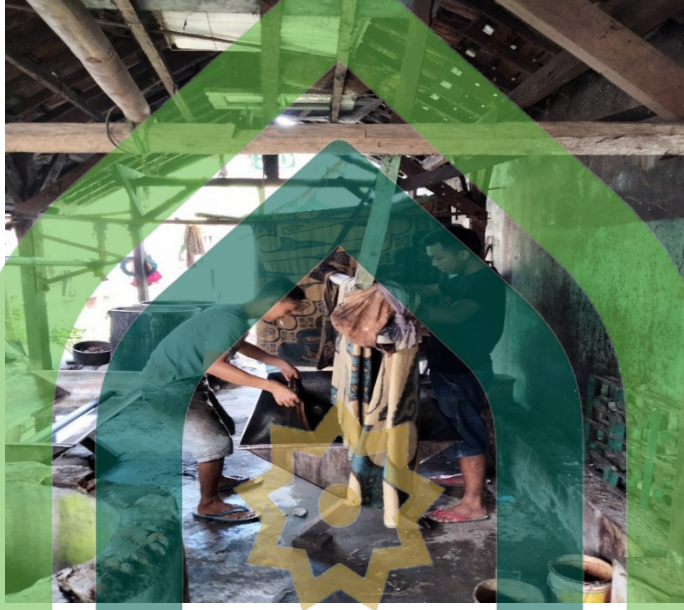
(proses produksi pengusaha batik akhmad solikhin)