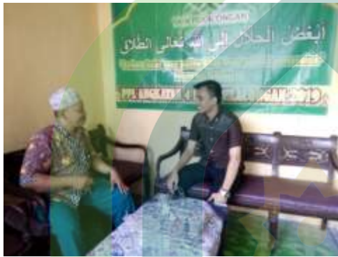
(Wawancara bersama konselor Islami BP4 Kota Pekalongan)