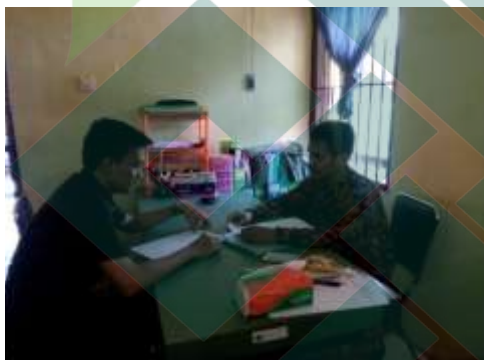
(Wawancara bersama staf BP4 Kota Pekalongan)