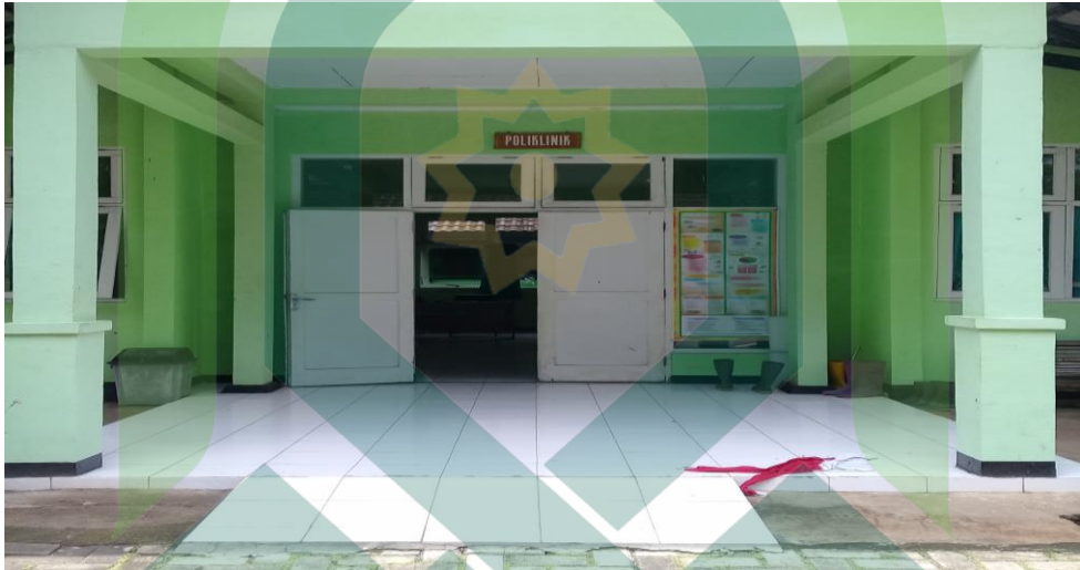
Poloklinik Panti Pelayanan Sosial Lanjut Usia "Bisma Upakara" Pemalang