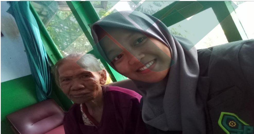
Wawancara bersama Penerima Manfaat di Wisma