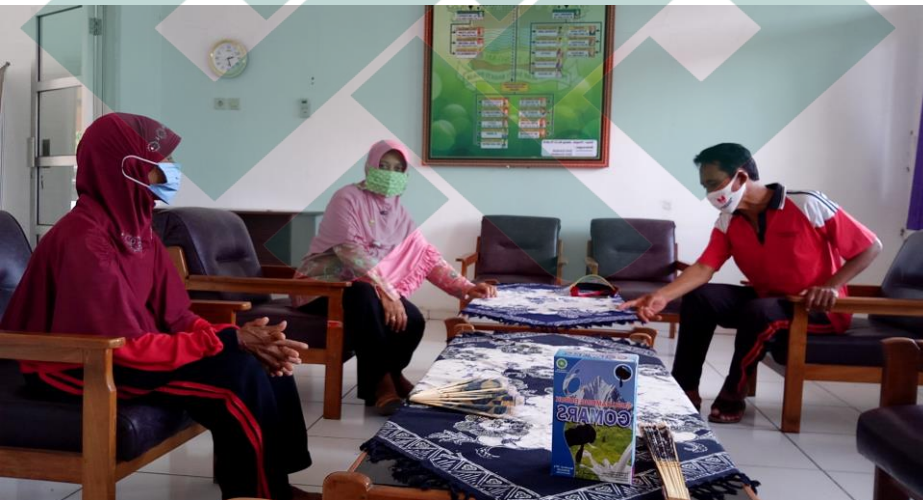
Kegiatan Bimbingan Individual