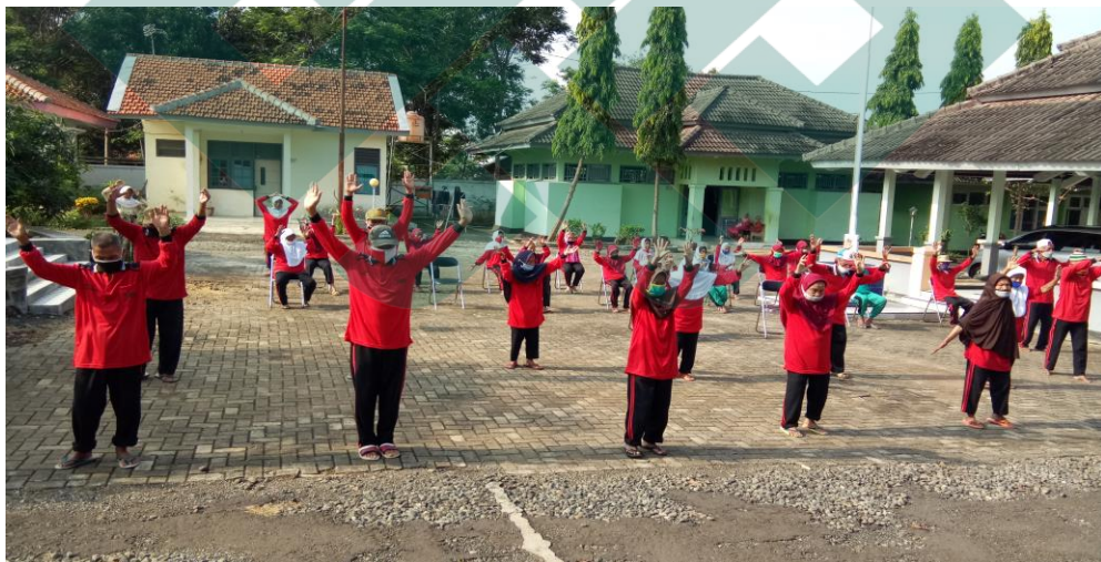
Kegiatan Senam Pagi