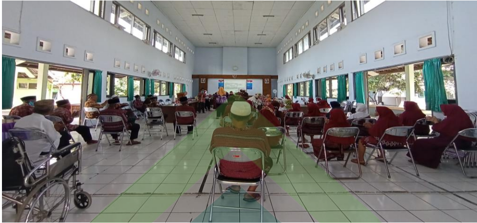
Pelaksanaan Bimbingan Rohani Islam selama Pandemi Covid-19 diisi oleh Pekerja Sosial dan Pegawai Panti Lainnya dengan Tetap Menerapkan Protokol Kesehatan