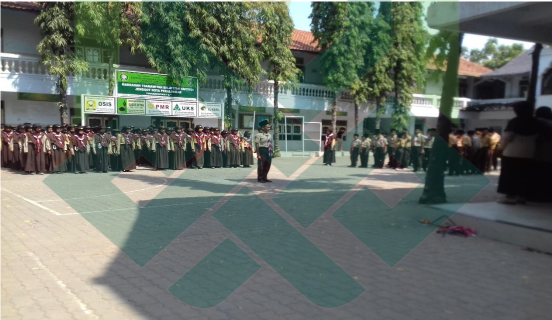
APEL PEMBUKAAN LATIHAN