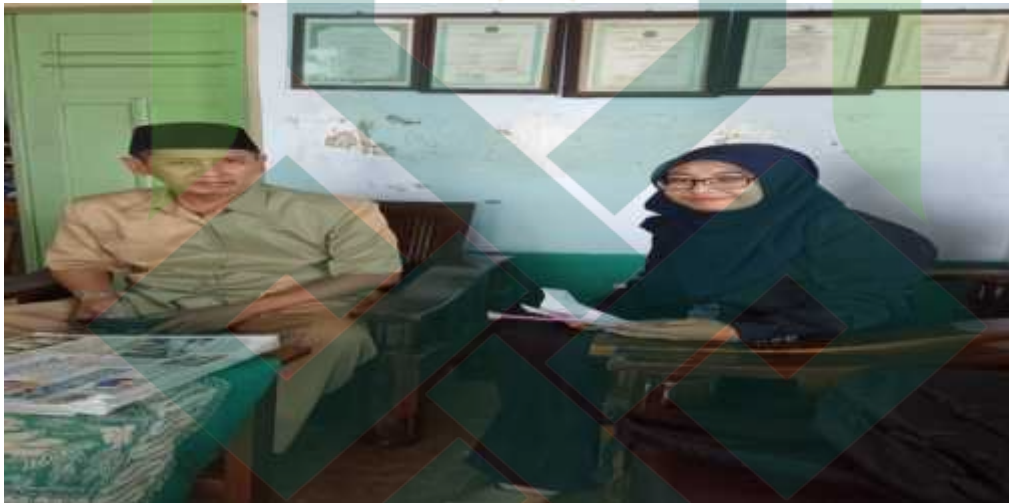
Wawancara dengan kepala Madrasah