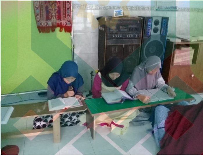
Kegiatan Tadarus Remaja