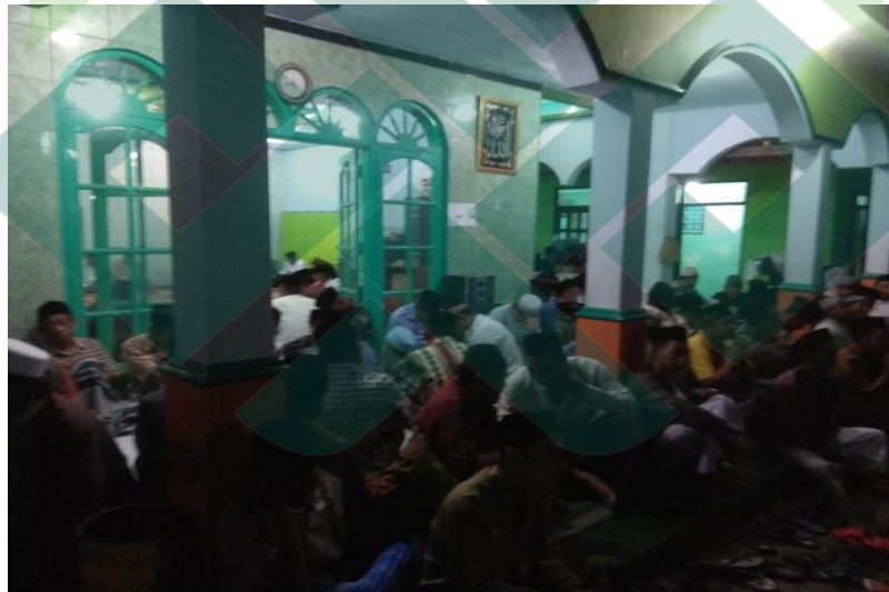
Kegiatan tahlilan bapak-bapak