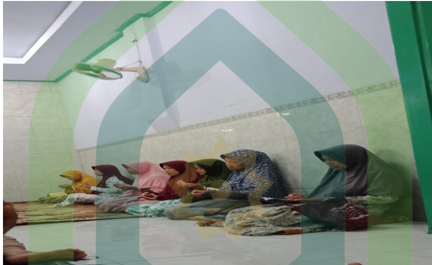
Kegiatan tahlilan Ibu-ibu