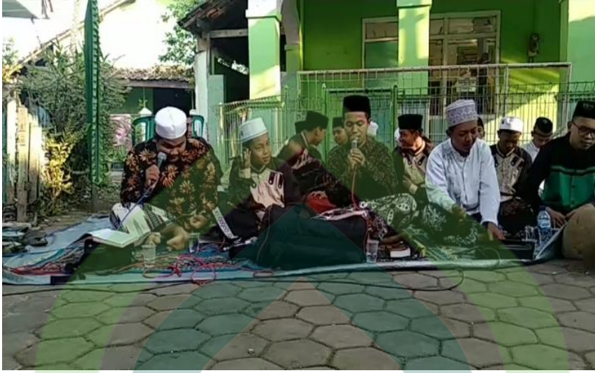
Kegiatan Rebana Remaja