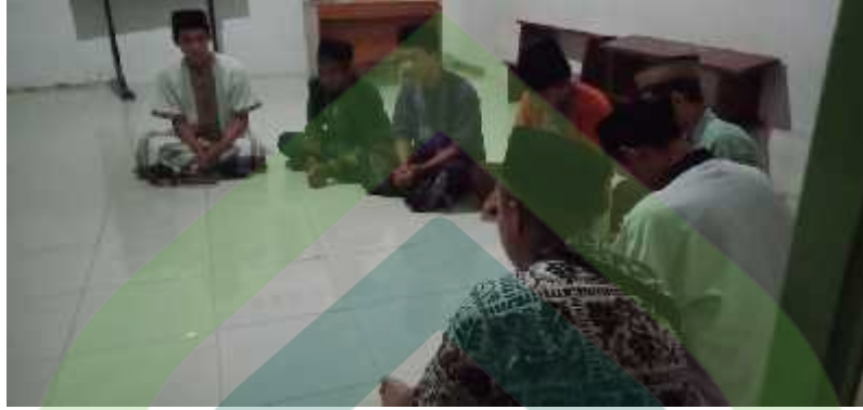
Kegiatan Remaja di desa Purwahamba