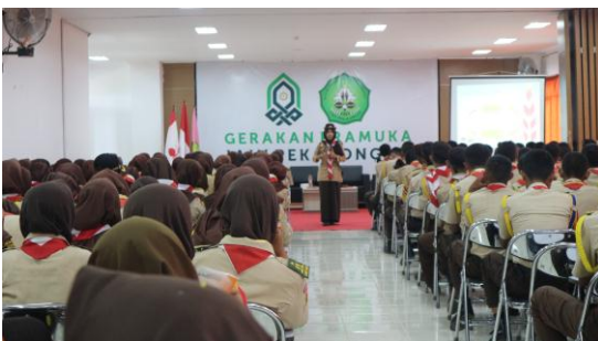
5. Kegiatan Seminar keprotokoleran