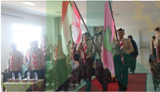
9. Kegiatan KMD