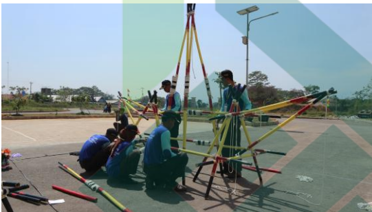
3. Kegiatan GTPP Tahun 2019