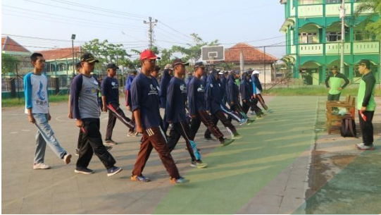
7. Kegiatan Latihan PBB