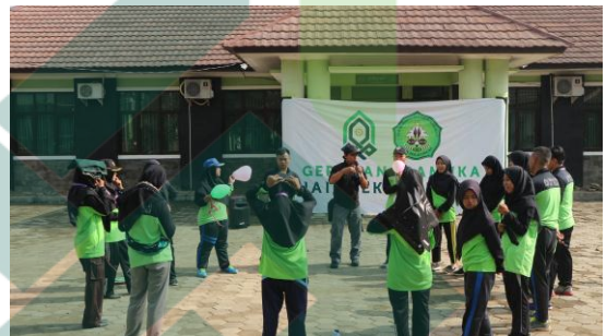
4. Kegiatan Pelatihan Outbond