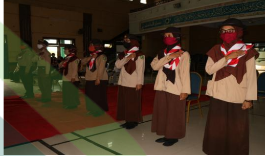
8. Kegiatan Pelantikan Pandega