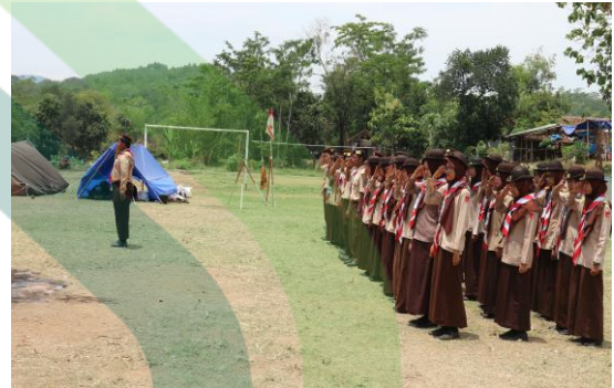
2. Kegiatan PERBARA