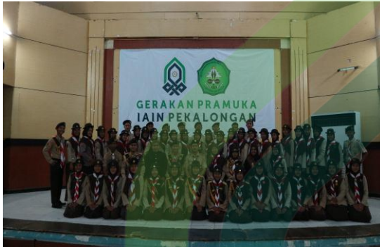
1. Kegiatan PTAR 2019