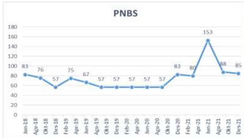
Gambar 1.3 Grafik Harga Saham PNBS