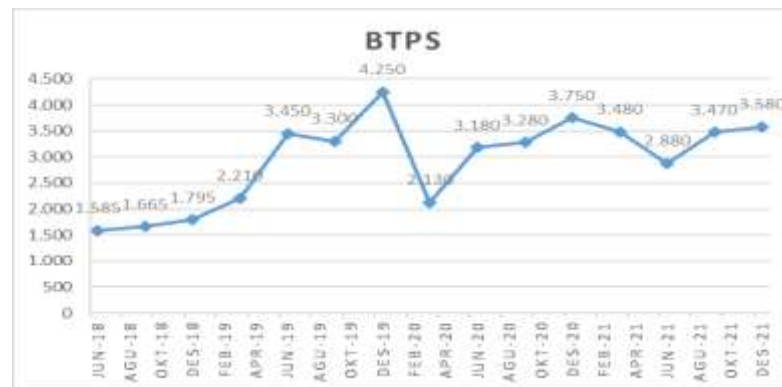
Gambar 1.1 Grafik Harga Saham BTPS

Adanya pandemi akibat Covid-19 selain berakibat pada kinerja keuangan perusahaan juga memiliki pengaruh terhadap harga saham yang mengakibatkan anjloknya IHSG paska Covid-19 mulai menyebar keberbagai belahan dunia. IHSG menurun dikarenakan terdapat saham-saham yang dijual dalam skala besar oleh para investor karena kepanikan akan adanya virus tersebut. Berikut adalah chart yang menunjukkan harga saham dari Bank BTPN Syariah, Bank Panin Dubai Syariah dan Bank Syariah Indonesia.