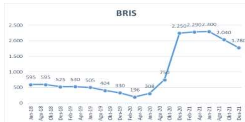
Gambar 1.2 Grafik Harga Saham BRIS