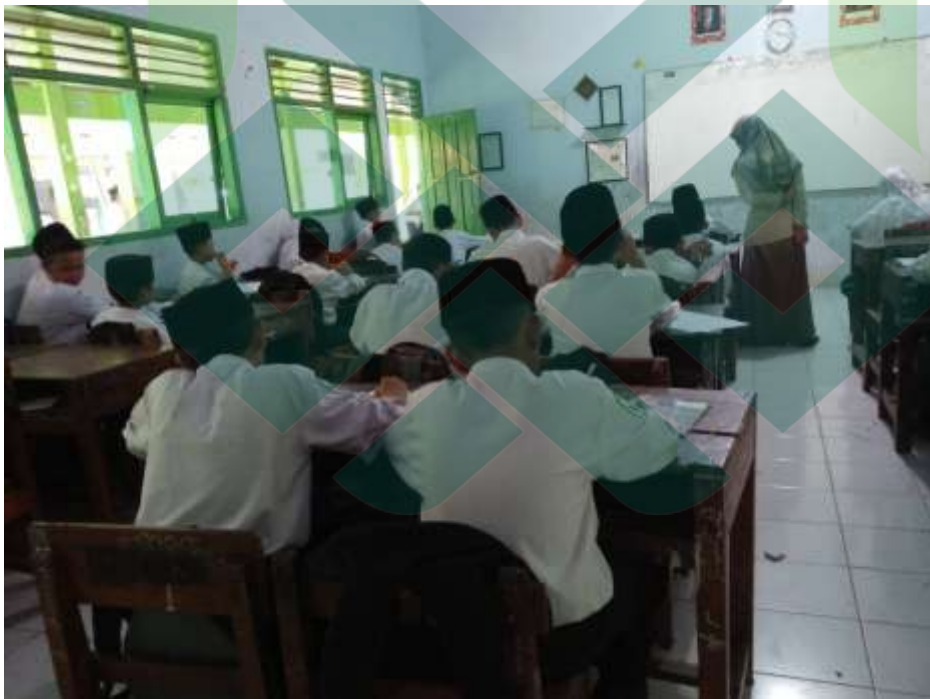
Waktu pembelajaran aqidah akhlak di kelas VII F