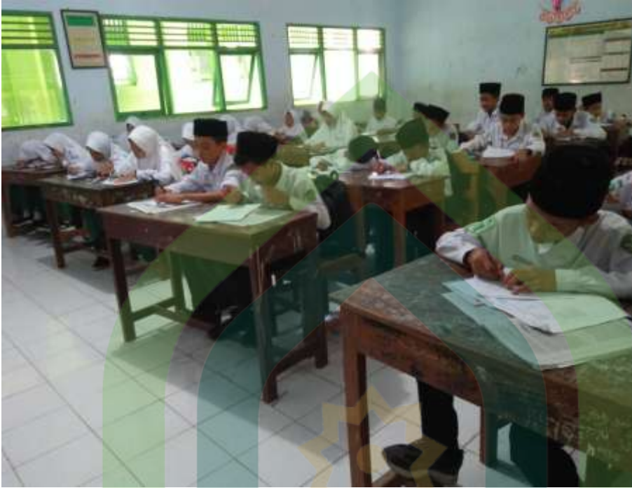
Wawancara dengan siswa MTs YMI Wonopringgo