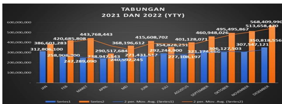
Data Indeks Tabungan LKMS tahun 2021-2022

Sumber : RAT (Rapat Anggota Tahunan) LKMS Tahun 2023