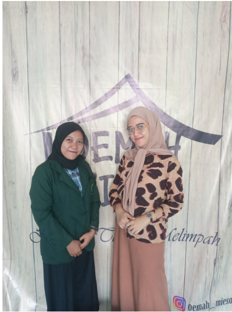
Dokumentasi bersama Pemilik usaha