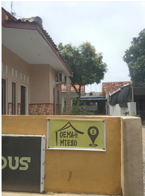
Dokumentasi Tempat Penelitian