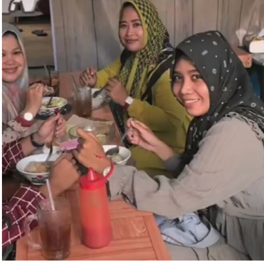
Dokumentasi bersama Responden