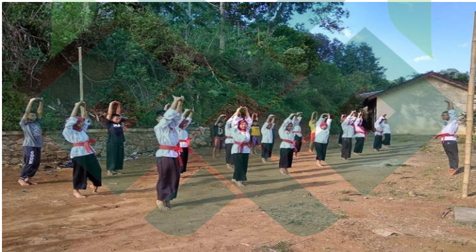
Gambar 1.2 kegiatan pemanasan sebelum memulai latihan tehknik gerakan pencak silat Merpati Putih di SMK Negeri 1 Lebakbarang.