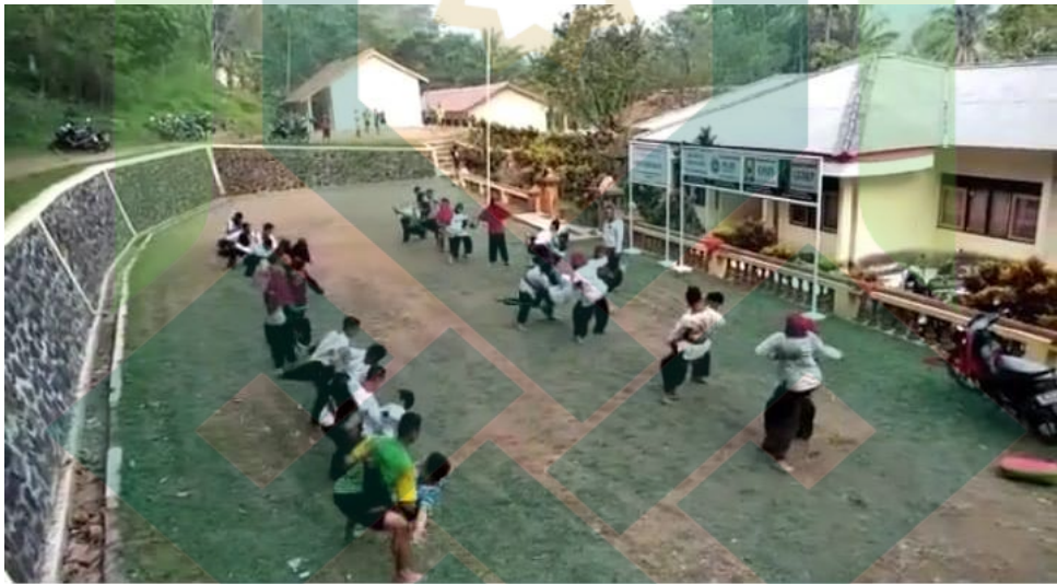
Gambar 1.4 Siswa sedang melakukan tehknik bertarung dalam pencak silat Merpati Putih di SMK Negeri 1 Lebakbarang.