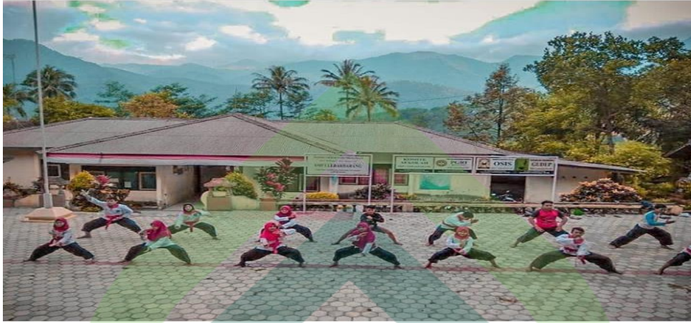
Gambar 1.3 para siswa ekstrakurikuler pencak silat Merpati Putih di SMK Negeri 1 Lebakbarang sedang melakukan tehknik gerakan bela diri.