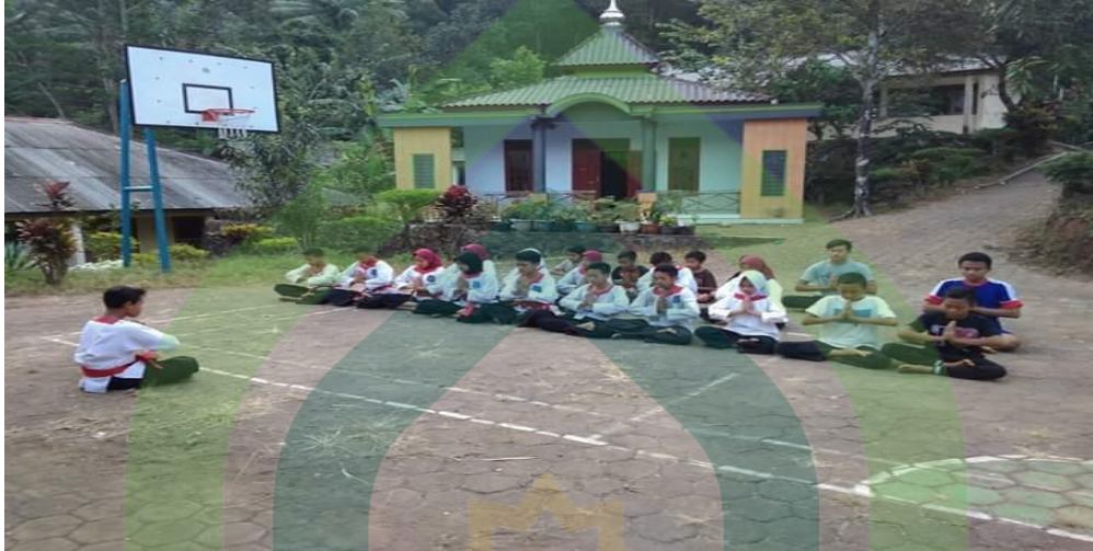
Gambar 1.1 kegiatan berdoa sebelum memulai latihan ekstrakurikuler pencak silat Merpati Putih di SMK Negeri 1 Lebakbarang.