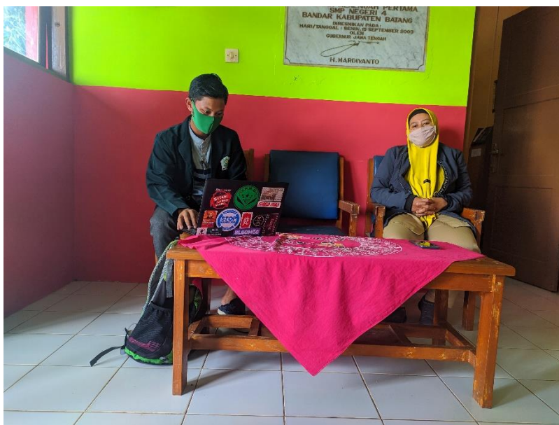
Gambar 2 Wawancara dg Guru BK