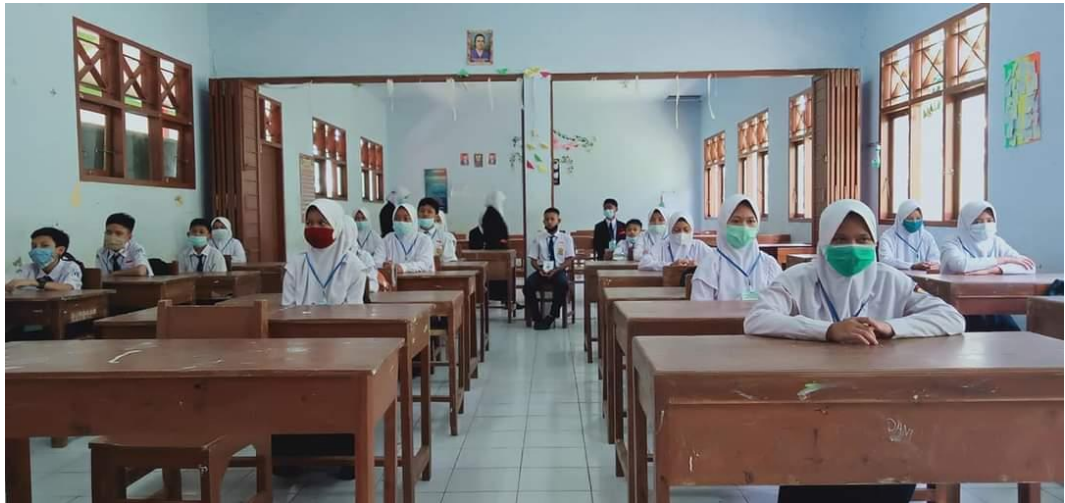
Gambar 5 Kegiatan KBM