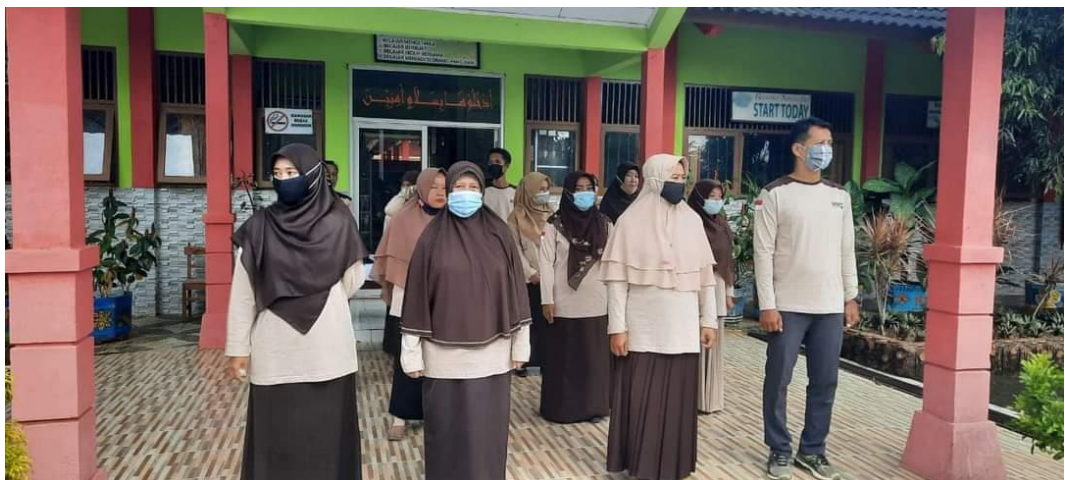
Gambar 6 Kegiatan Upacara