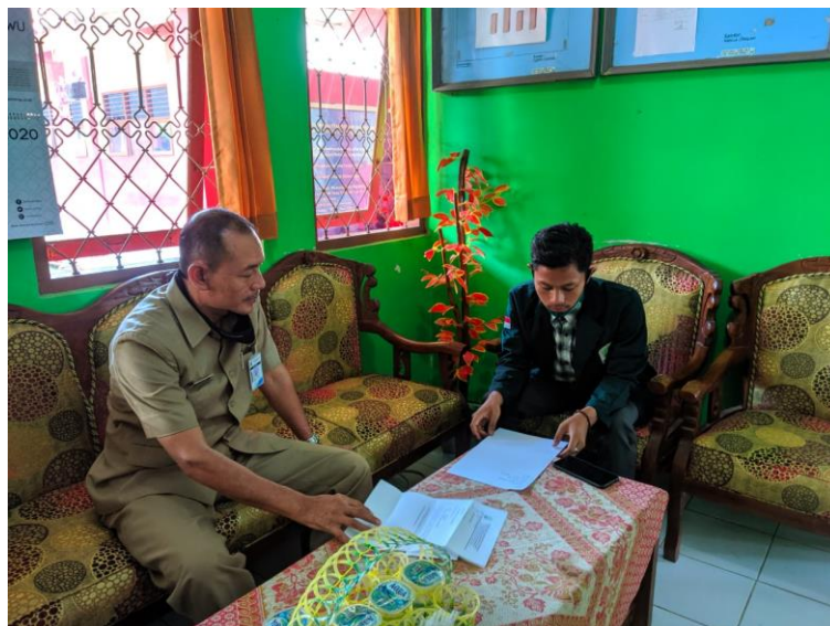
Gambar 1 Bertemu dg Kepala Sekolah