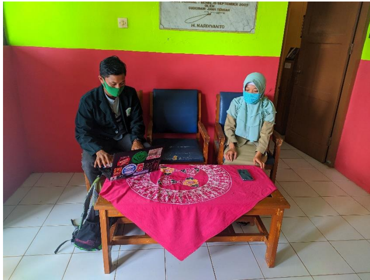
Gambar 3 Wawancara dg Guru PAI