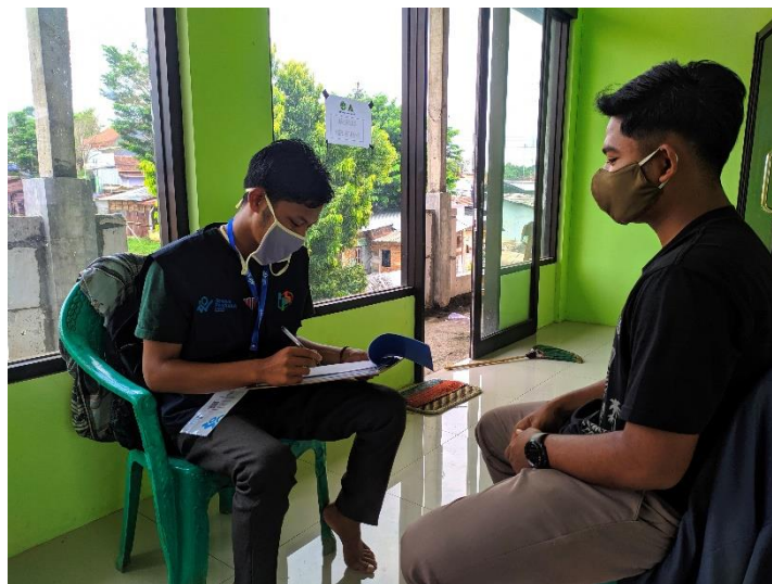
Gambar 4 Wawancara dg Siswa