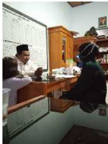
Wawancara dengan ustadz-ustadzah