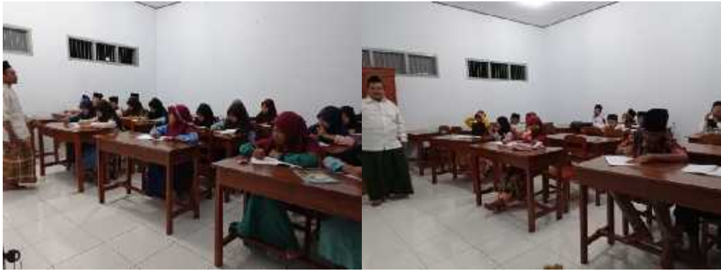
Dokumentasi Kegiatan Belajar Mengajar