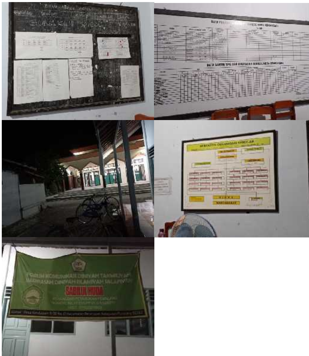
Dokumentasi Madrasah Diniyah Awaliyah Sabilul Huda