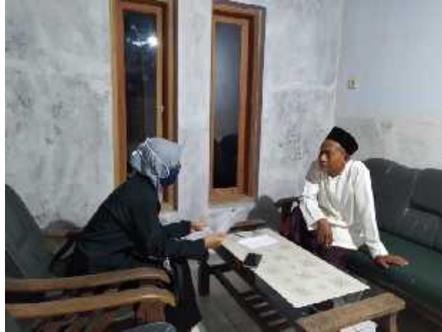
Wawancara dengan Ketua Madrasah Diniyah Awaliyah Sabilul Huda Desa Kendalsari