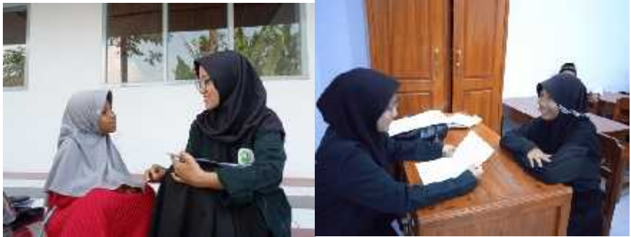
Wawancara dengan peserta didik