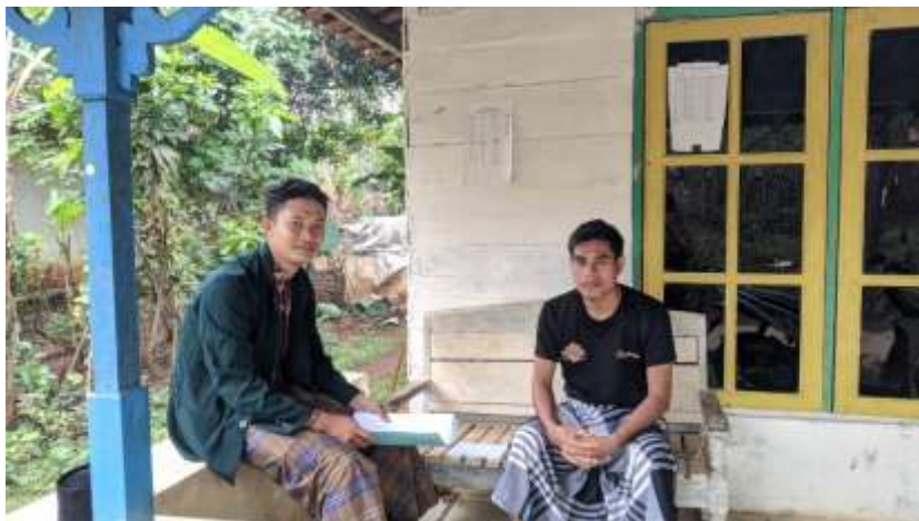
Wawancara dengan Ketua Majelis Taklim Nurul Hikmah