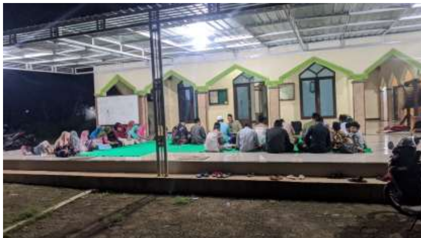
Rutinan malam Minggu Pahing kajian Kitab Al Barzanji Majelis Taklim Nurul