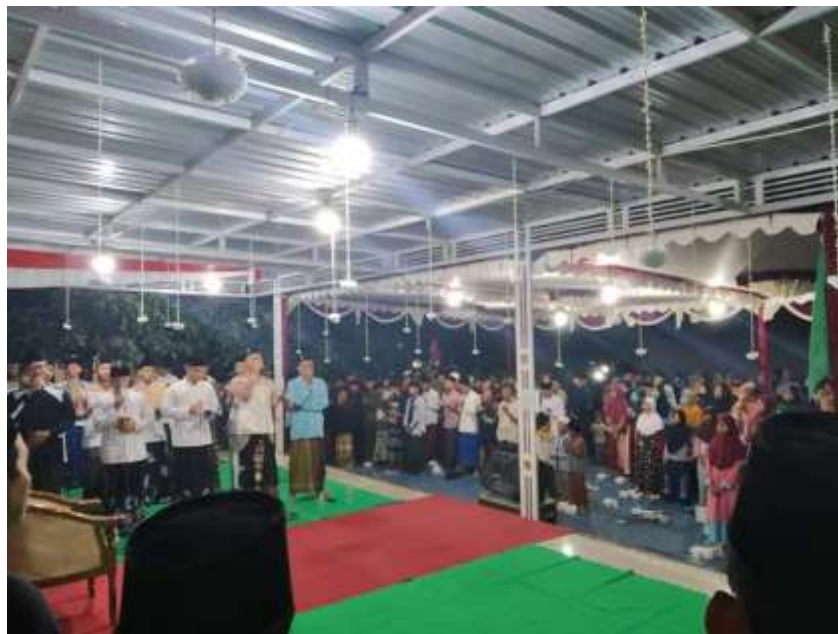
Peringatan Maulid Nabi Muhammad SAW.