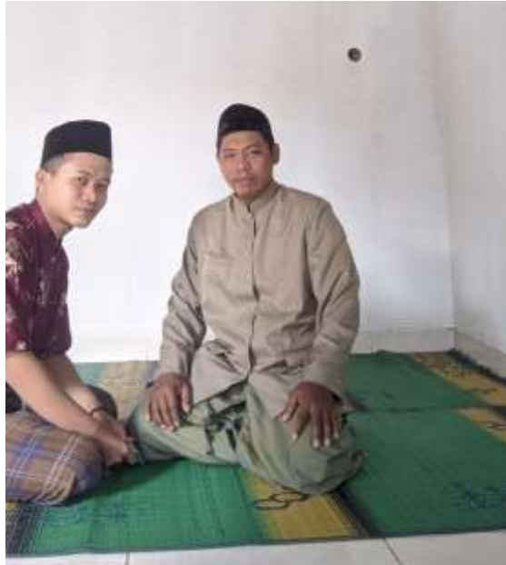
Wawancara dengan Pembina Majelis Taklim Nurul Hikmah