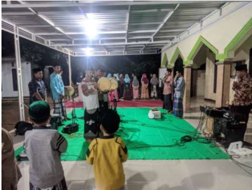
Rutinan setiap Malam Minggu Majelis Taklim Nurul Hikmah