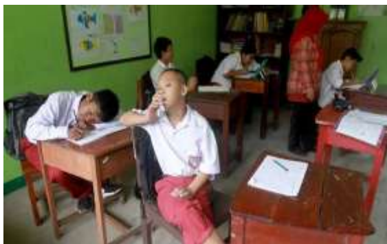
Gambar 5. Pembelajaran PAI