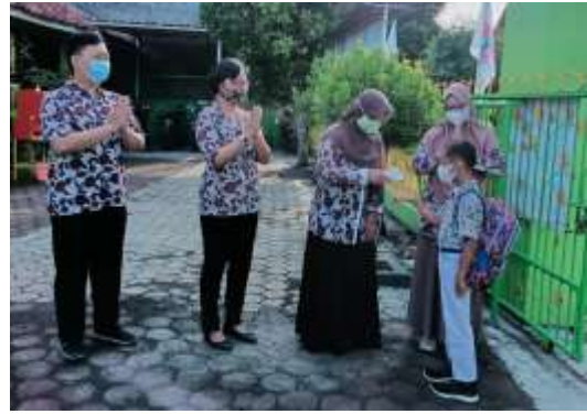
Gambar 8. Penanaman 3S