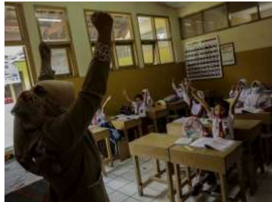
Gambar 4. Pembelajaran PAI