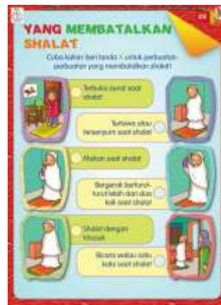
Gambar 10. Contoh media pembelajaran