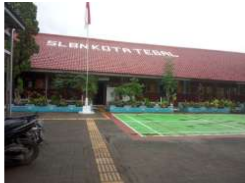
Gambar 2. Lapangan Upacara