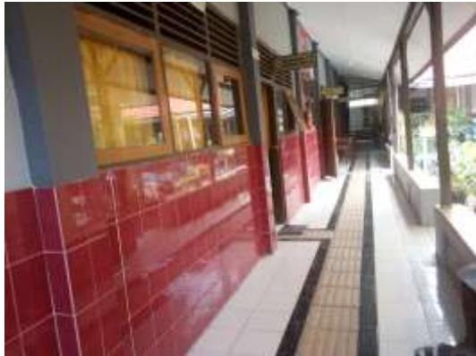
Gambar 3. Ruang Kelas