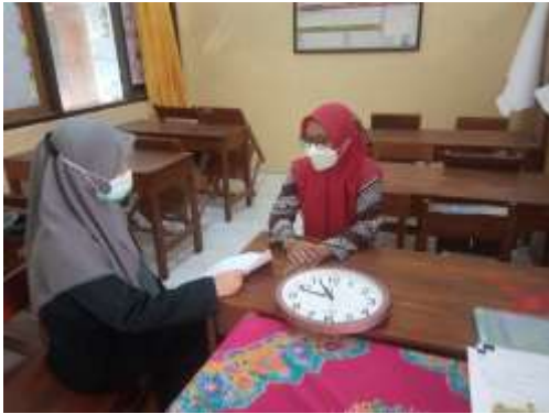
Gambar 7. Wawancara guru PAI