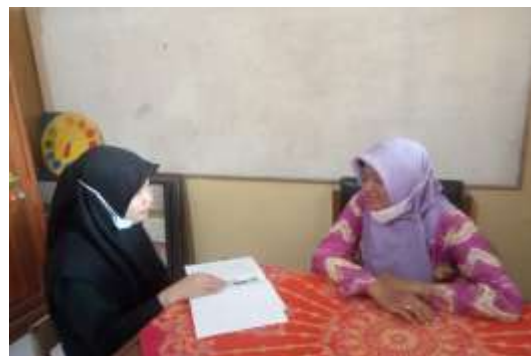
Gambar 6. Wawancara dengan walikelas