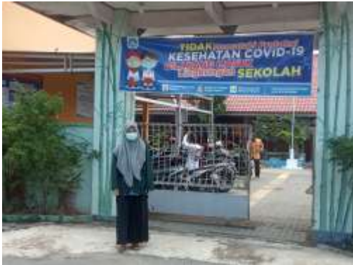
Gambar 1. Gerbang Depan