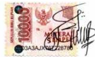
KUNTARI NIM. 2118203